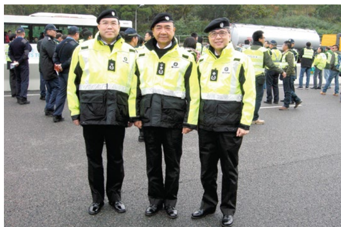
救傷隊管理層親自觀察演習情況

馬總監指出，聖約翰救傷隊是一間「百年老店」，有很多問題積聚下來，是需要有勇氣解決，就以高層的積極性來說就是一項大問題。「每個人加入救傷隊都是滿腔熱誠，但假以時日，部份人的熱誠消淡了，偏偏這些人可能現正在救傷隊身居要職，下屬想進行一些改革，但身居要職者不單只不支持、不幫手，更可能會出手攔阻。正因如此，救傷隊的發展經常遇到一些困難！」面對這種問題，馬總監表示，他很尊重這些長官們過去的貢獻，但為了救傷隊發展，他會加設更多高級職位，加快晉升一些有魄力的長官，以支持救傷隊的發展。