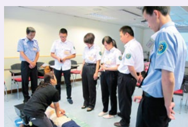
講師示範兒童心肺復甦法