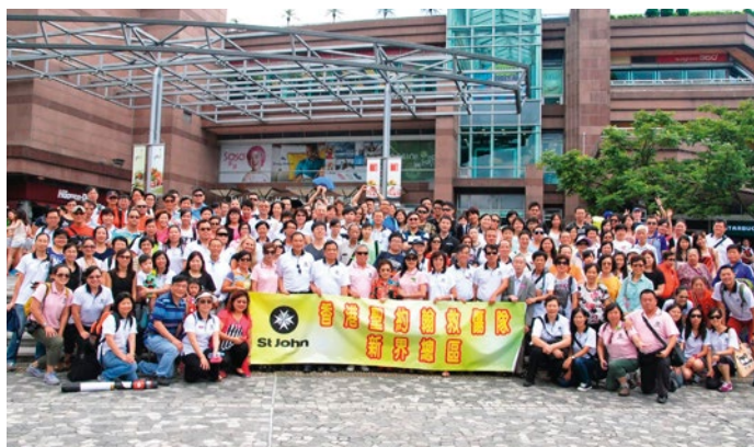
新界總區慶祝成立一周年——香港一天遊於2014年7月20日舉行，讓新界總區上上下下人員及嘉賓共186人歡聚一堂，遊覽山頂及赤柱，並在東涌享用自助晚宴，暢遊港九新界，令各位盡慶而還。