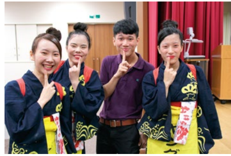
參觀鹿兒島短期女子大學

等等，最特別的莫過於入住當地家庭，我們更有寶貴的機會與鹿兒島縣政府官員會面，就我們的主題“優質生活”、經濟及環境資源管理上互相交換意見。最後一部份的回訪活動中，我們一眾香港青年代表擔當了香港大使的角色，讓他們可以深入認識和了解香港的文化。