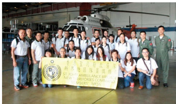
新界總區隊員俱樂部於2014年7月12日，安排了25名隊員，到香港飛行服務隊位於香港國際機場的總部，進行參觀及交流活動，認識了飛行服務隊日常運作情況，以及先進裝備的應用，並了解在危急或災難事故拯救行動中與其他部門的合作情況，令出席的隊員對香港飛行服務隊的服務有更深入的了解。