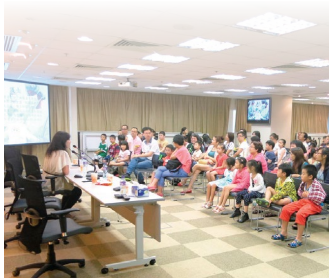
「小醫生培訓計劃」講座當天出席的小朋友連同家長約120人

2014年7月13日下午，聖約翰救傷會副總監李家仁醫生太平紳士，護理學顧問區炳麟先生及吳雅茵女士應民健聯邀請，出席一個名為「小醫生培訓計劃」講座。由區炳麟講師介紹救傷會的急救課程，並講解受傷出血的處理方法。之後吳雅茵女士講解小孩家居護理常識。最後由李醫生介紹小朋友邁向醫生專業的路線圖，並解答小朋友及家長的提問。