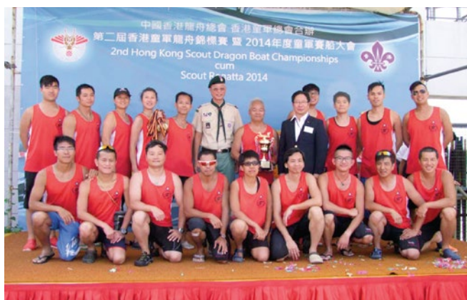
2014年10月12日第二屆香港童軍龍舟錦標賽制服團體邀請賽冠軍