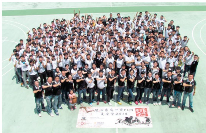
近三百名長官及隊員於夏令營一起合照

過去三年，我們先後籌辦了親子心肺復甦法證書課程、東平洲地質考察、挪亞方舟生命教育展覽、北京親子考察交流活動、家庭盆菜宴、親子夏令營及家庭同樂日等活動，總受惠人次共多達一萬人。我們更於上年四月至十一月期間，與青山醫院精神健康學院合辦一系列免費精神健康講座，讓隊員及家人學習辨識、接納及調節情緒；並藉以鼓勵隊員面對壓力時，與家人傾訴，建立關愛精