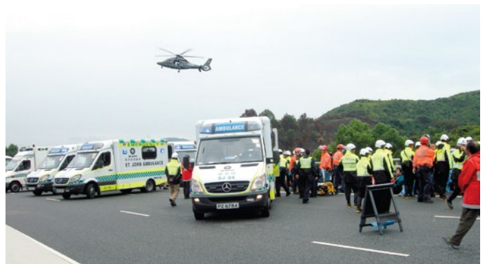
直升機在救援現場上空盤旋找位置降落