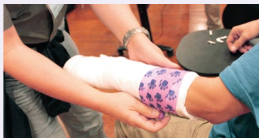
導師示範包紮方法

掌握安全地捕捉動物的技巧外，更要學識如何眼明手快地把繃帶紮在受傷的動物身上以固定牠的受傷部位。