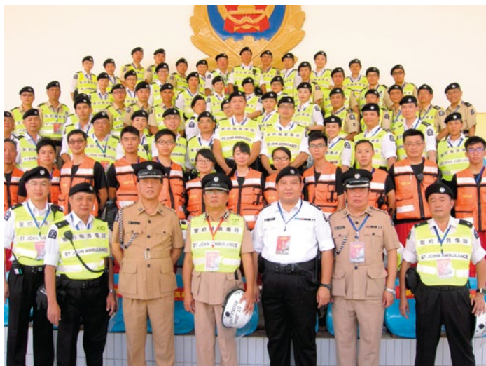
參與演習人員合照

Joint Exercise with Shenzhen, Hong Kong, Zhuhai and Macau in October 2014