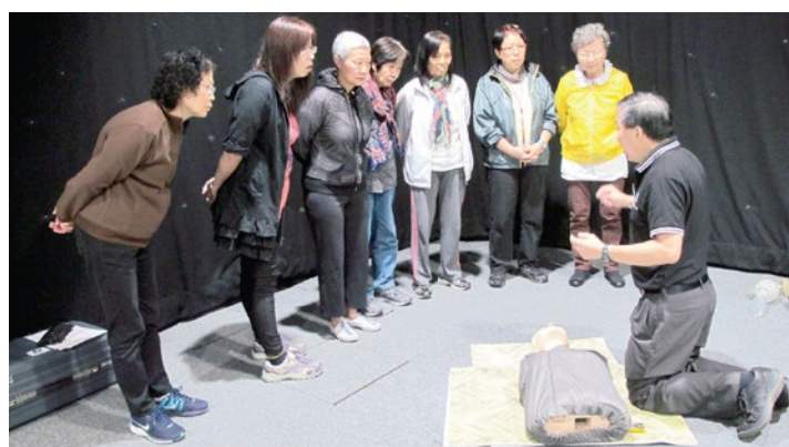
急救學講師示範心肺復甦法