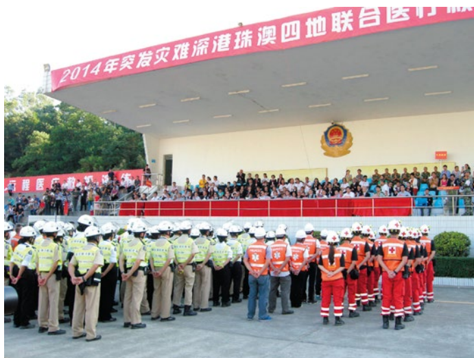
演習人員列隊接受檢閱