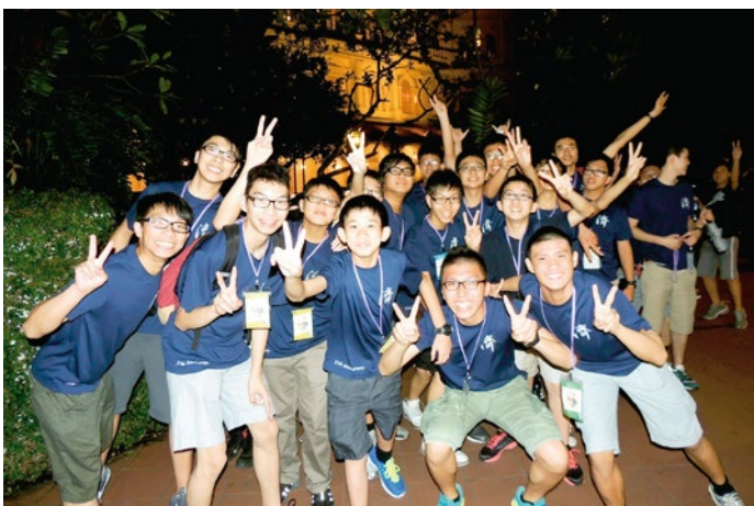
Visiting the downtown of Singapore