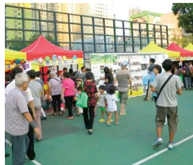
區內居民參與攤位遊戲