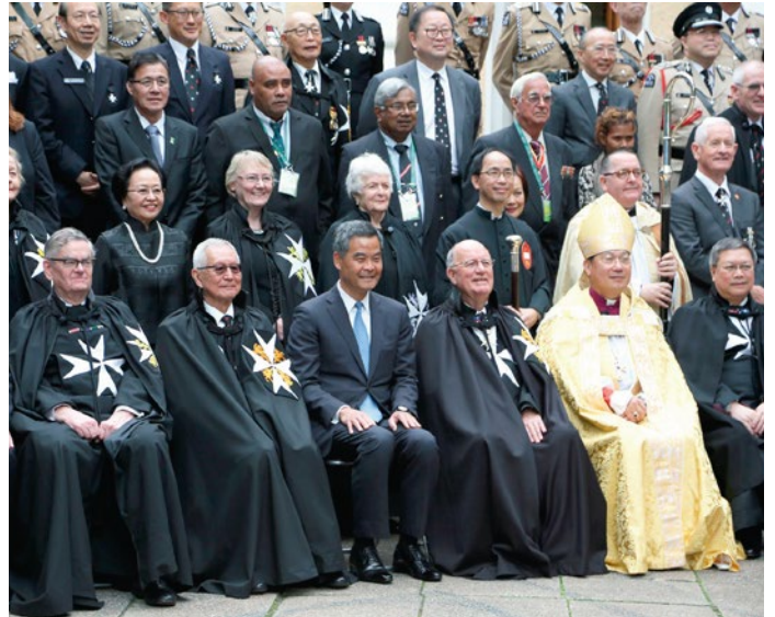
香港特別行政區政府行政長官梁振英先生出席議院成立典禮

與此同時，理事會主席莫禮富醫生亦被擢升為「正義騎士」"Knight of Justice (KStJ)"，有關之授勳儀式亦將於同日頒授。