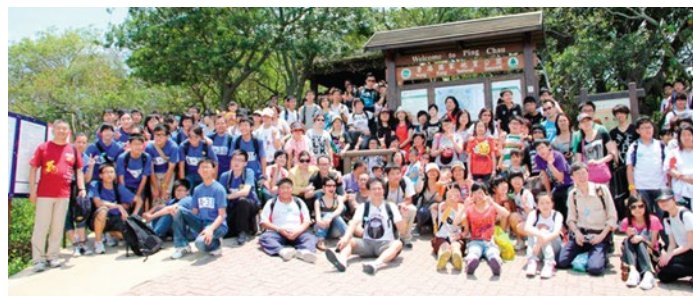
過百名少青團隊員及其家人一同到香港國家地質公園考察