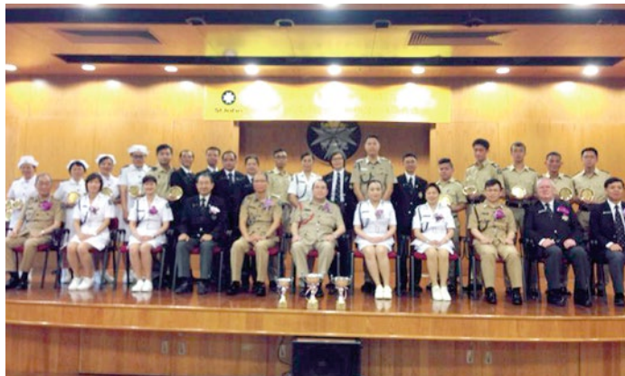
得獎者與長官及會長合照

2013年度『當值獎勵計劃』於2014年5月3日，假香港麥當勞道二號聖約翰大廈7樓禮堂舉行。當天頒發了超過100個獎項給勤奮當值的長官，隊員和少青團隊員，以鼓勵和表彰他們的積極參與及對社會服務的貢獻。