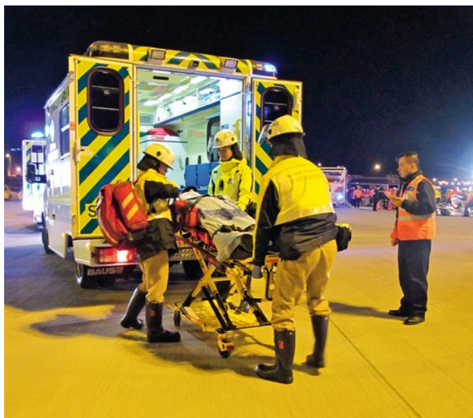
救傷隊隊員將模擬空難傷者送院

演習中，機師馬上向航空交通指揮塔報告事故，指揮塔人員隨即啟動失事警報通知所有相關單位。有關緊急救援隊伍馬上趕往事故現場，機場緊急應變中心亦已啟動，以便各方緊密溝通及有效協調工作。在疏散機上乘客及機組人員後，參與演習的醫院亦派出一名醫療控制主任及兩支緊急醫療隊到場提供救助。