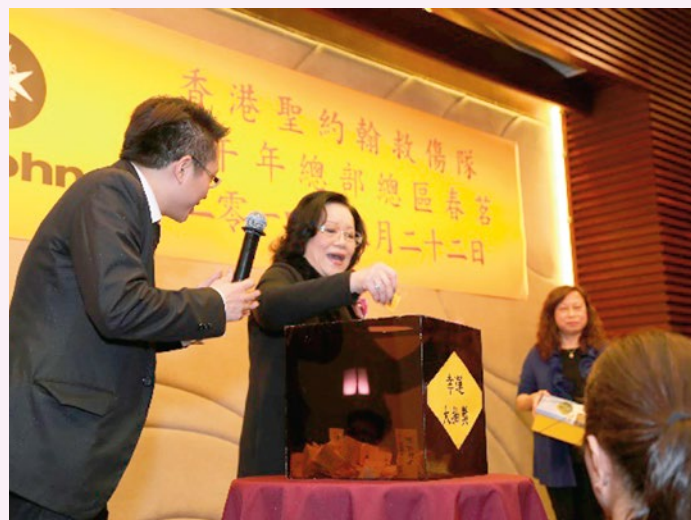
抽獎活動緊張時刻又到了