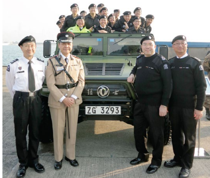
馬總監率領少青團參觀軍營

隊發展有利的事，我都去會做，至於要做得成功，必須得到天時、地利及人和，更需要資金的支持，所以就全賴聖約翰的兄弟姐妹齊心努力，講真的，我只是做決定，還是要靠大家去實踐。」