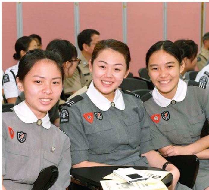
少青團隊員出席頒獎禮

2013年度『當值獎勵計劃』於2014年5月3日，假香港麥當勞道二號聖約翰大廈7樓禮堂舉行。當天頒發了超過100個獎項給勤奮當值的長官，隊員和少青團隊員，以鼓勵和表彰他們的積極參與及對社會服務的貢獻。