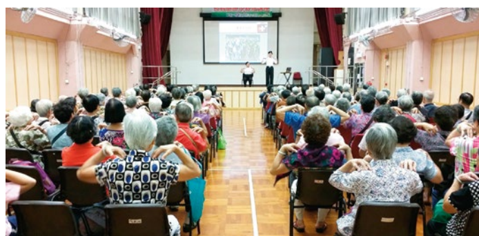
2014年9月21日南昌北居民聯會