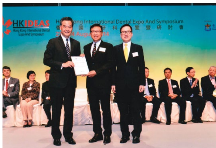
行政長官梁振英先生頒發嘉許狀予香港聖約翰救傷隊，並由牙科總區助理總監蘇平翬醫生代表接受

設的先導計劃。於2014年8月22日，香港特別行政區行政長官梁振英先生，在香港牙醫學會會長梁世民醫生陪同下於2014 HKIDEAS (Hong Kong International Expo and Symposium) 開幕儀式中，將學會之嘉許狀頒發給香港聖約翰救傷隊，並由牙科總區指揮官蘇平翬醫生代表接受。