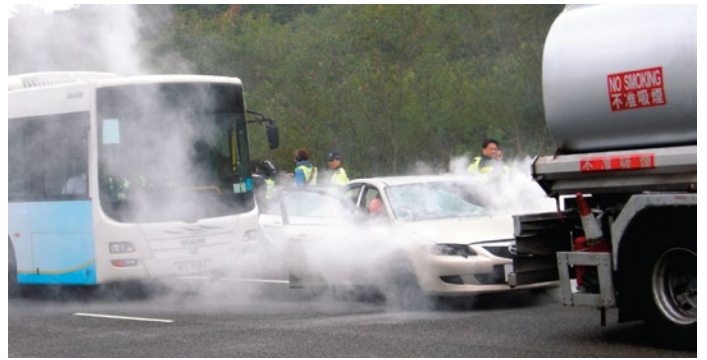
模擬車禍現場十分逼真

政府飛行服務隊接獲消防處通知，派出執行公路拯救行動的直升機飛抵現場，先後3次往返，送走3名重傷者，救護車則將54名傷者送往廈村秤車站改裝的「廈村醫院」救治，運油車所屬石油公司亦派出空缸運油車到達現場，卸下損毀運油車上的燃油，整項救援工作不需1小時完成。