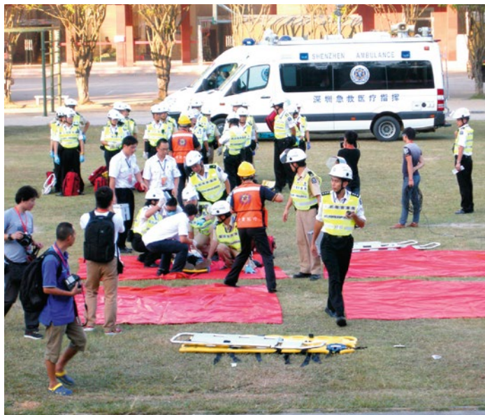
聖約翰救傷隊為傷者急救

演習由總部總區內地及海外事務分區策劃，事故模擬深圳福田銀湖汽車站附近一幅山坡突然崩塌，兩輛載有來自港、珠、澳三地遊客的大巴駛至，被泥石流衝撞至翻側，兩大巴上共數十名乘客受傷，由於兩輛肇事大巴乘客有部份來自港、澳及珠海等地居民，深圳市急救中心同時通知香港聖約翰救傷隊、珠海市急救中心及澳門紅十字會民防救援隊，立即派員增援及準備將傷勢穩定傷員轉運回港、珠、澳等地醫院。香港聖約翰救傷隊、澳門紅十字會及珠海市急救中心，分別派出救援隊伍趕赴現場，與深圳市急救中心人員聯手進行救援行動。