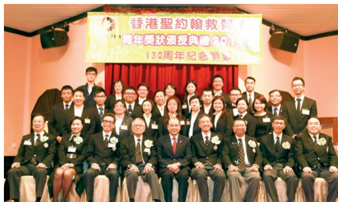
主禮嘉賓與2014/2015年聖約翰講師(急救學)訓練班學員合照

救傷會周年獎狀頒授典禮及130周年晚宴於 2014年11月9日(星期日)假座警官會所舉行。當晚邀請了勞工及福利局局長張建宗太平紳士 GBS 擔任主禮嘉