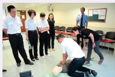
講師指導學員進行成人心肺復甦法

雲南省急救中心分別於2014年9月10日、18日及24日派出三隊人員，來港接受由救傷會提供的基本生命支援術培訓，學習心肺復甦法及哽塞處理。他們是雲南省急救中心由中心的主治醫師、醫師、主管護師、護師及救護員組成的團隊，藉此機會交流兩地經驗。