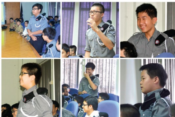
Sharing the trip's experience with the senior officers of SGP SJ in the Headquarters