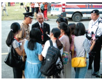
馬總監回應傳媒訪問