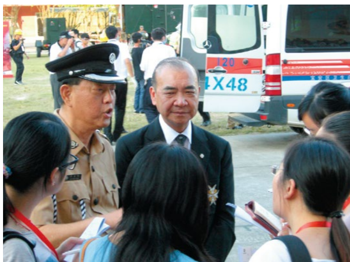
馬總監接受內地傳媒訪問

四地演習目的包括：1、檢驗深港珠澳聯合醫療救援的時效性；2、建立深港陸路口岸傷患者轉送綠色通道；3、提高多方聯合救援的組織指揮能力；4、嘗試發展深圳直升機空中救援新模式。而最重要是四地救護人員加強溝通，互相熟悉對方的工作模式，做好日後共同應對緊急事件的準備。