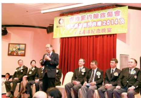
勞工及福利局局長張建宗太平紳士 GBS 為周年獎狀頒授典禮擔任主禮嘉賓