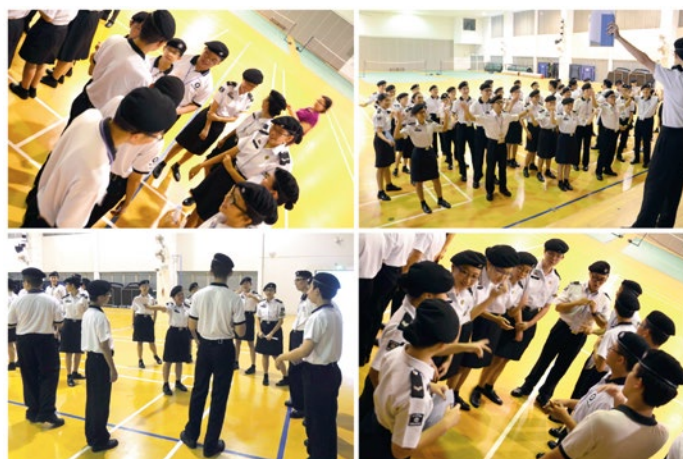
Ice breaking games with the Cadets from the River Valley High School