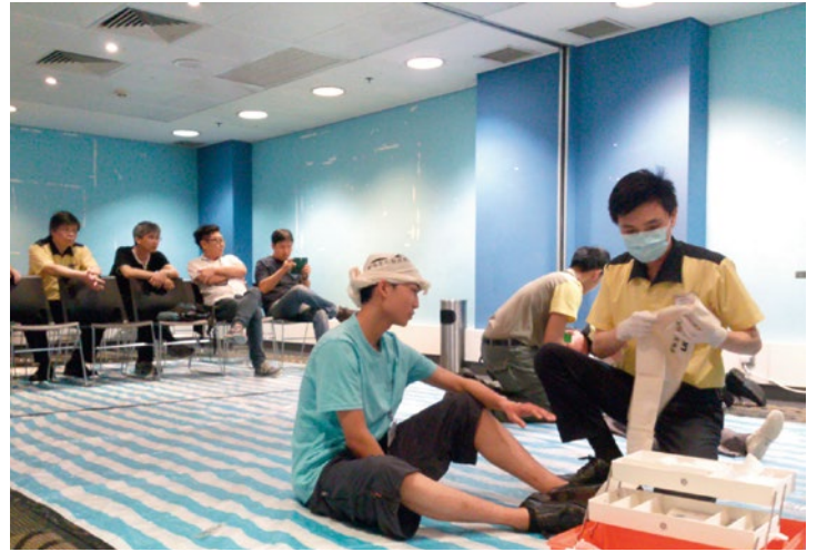
港鐵職員以模擬情景方式在指定時間內處理急救個案