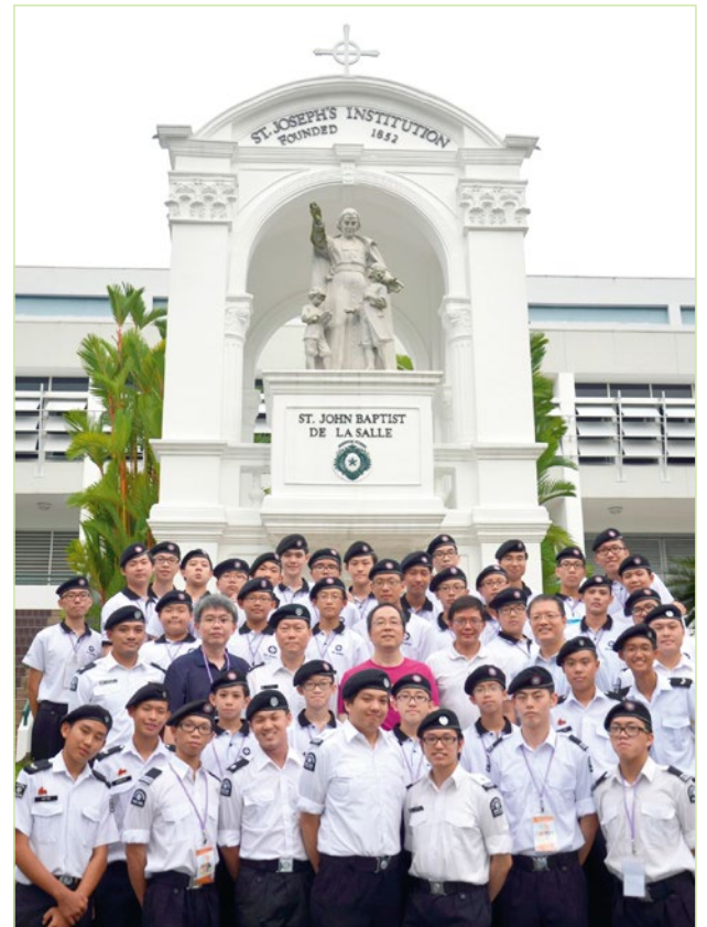
Group photo with the Officers and Cadets from the St. Joseph's Institution

Certainly this trip could not have happened if there was no good support from our Principal and Teacher-in-Charge, the officers and cadets from Singapore, my supervisors from Corps D1 and Region D, our Youth Office, and some other officers from the Administrative Region. But Boys (from SFX), it's also you who have made it happen. You have clearly demonstrated in the trip what you have inherited from your elder brothers and what brotherhood means. You have also shown to our friends in Singapore what St. John Cadets are like in Hong Kong. I am so proud of you, Boys.