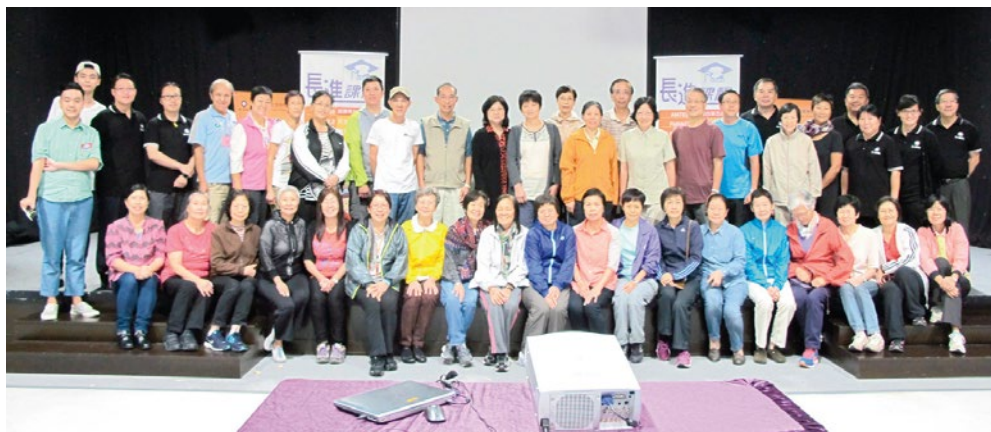
參加課程學員大合照

這個課程的參加者大多是已退休的哥哥姐姐，他們體現了終身學習的精神，成為急救員的一份子。