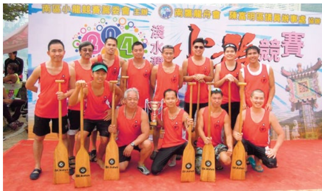
2014年6月2日香港仔龍舟競渡大賽 330米混合中龍初賽第三名