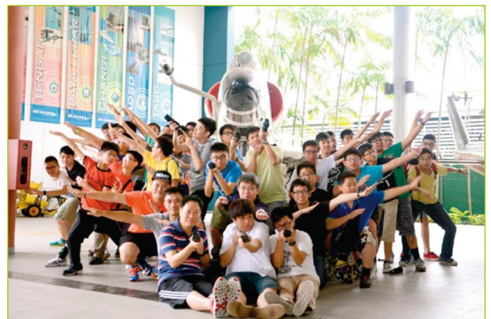
Visiting the Air Force Museum