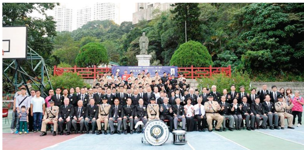
2014年11月1日全體孔聖支隊長官及隊員大合照

孔聖支隊經歷75年的發展，人才輩出，至今已經有九名各級長官及三十一名隊員。在各長官及新舊隊員共同努力下，孔聖支隊定會更加成功，為社會提供更好的救傷服務，邁向光輝的未來。