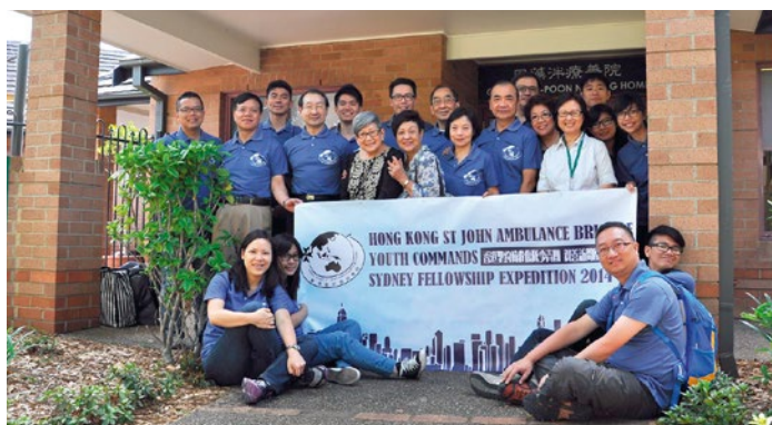
訪問團團員拜訪周藻洋療養院