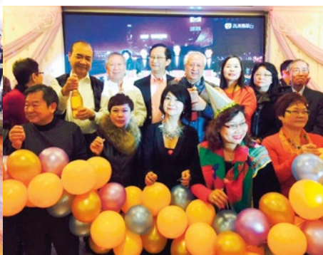
在2014年12月31日，新界總區舉辦除夕倒數晚會，共三百多人參與，氣氛熱鬧，表演精彩，獎品豐富，由籌備到活動當日，各會長、長官及隊員都非常投入，為迎接新一年，增添無限喜悅及興奮，載歌載舞，齊齊倒數，祝願在2015年，香港更和諧，救傷隊更進步，人人生活愉快。