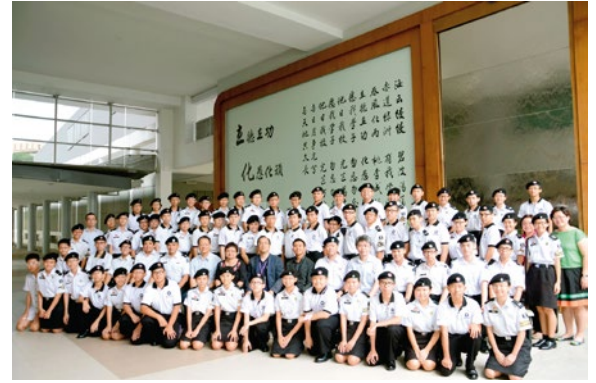
Group photo with the Officers and Cadets from the River Valley High School

culture, or making new friends. These FIRST-TIMES have also catalyzed the growth of these young men, internationalized their horizon, and equipped them with some unique capability in tackling future challenges.