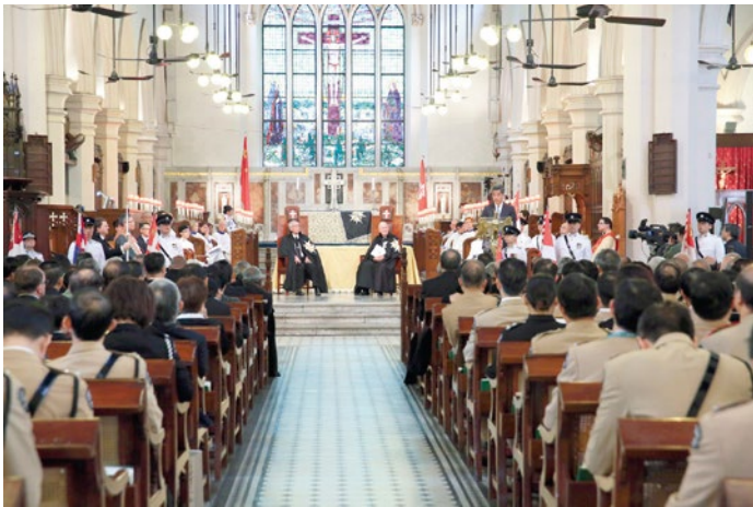
議院成立典禮於聖約翰座堂舉行