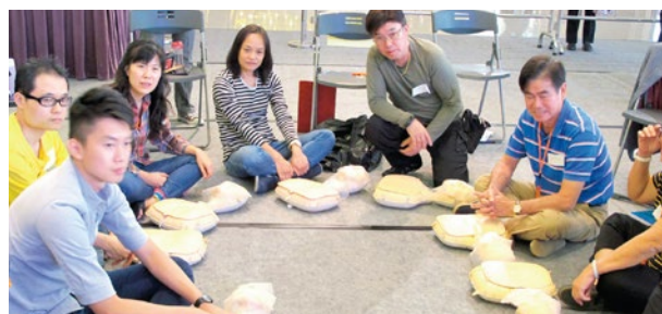
參加者正在練習心肺復甦法