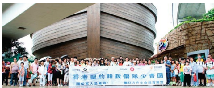
過百名少青團隊員及其家人一同到挪亞方舟進行生命教育之旅

2014年度之計劃亦已於八月展開，透過親子夏令營加強隊員之團體合作，並讓隊員與家人分享在制服團體生活中的經歷和體驗；同時透過球類同樂日，加強隊員及其家人間之合作能力及溝通技巧。此外，三月將舉辦家庭同樂日及SING SING同樂日，透過親子競技比賽、攤位遊戲及歌唱比賽等，讓長官、隊員及其家人與眾同樂，拉近隊員及家人的距離，增強他們之間的溝通，一同從輕鬆的氣氛中享受家庭樂。