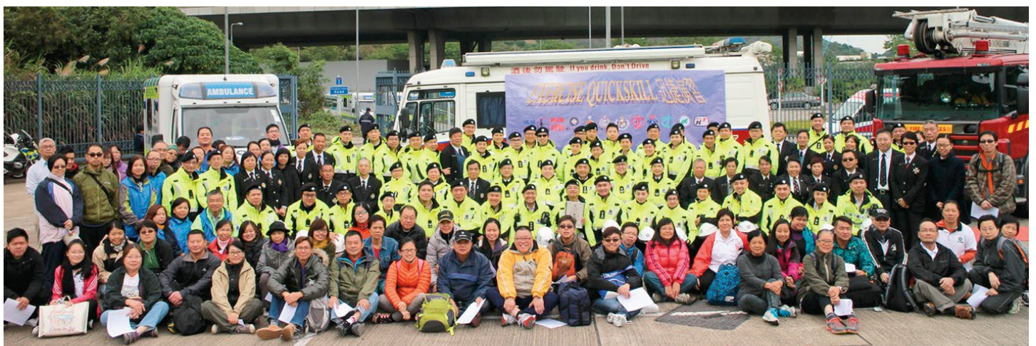
聖約翰救傷隊長官、會長及參與演習人員合照