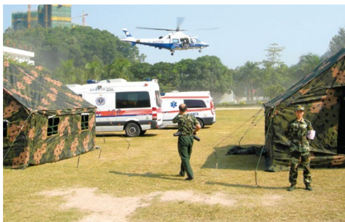
深圳公安直升機參與演習

四地演習目的包括：1、檢驗深港珠澳聯合醫療救援的時效性；2、建立深港陸路口岸傷患者轉送綠色通道；3、提高多方聯合救援的組織指揮能力；4、嘗試發展深圳直升機空中救援新模式。而最重要是四地救護人員加強溝通，互相熟悉對方的工作模式，做好日後共同應對緊急事件的準備。