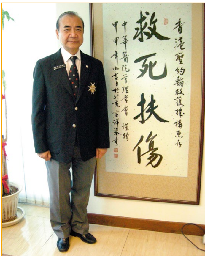
「救死扶傷」是聖約翰救傷隊使命

2014年7月，馬總監獲委任為「同心同根萬里行」總團長，並獲特首授予特區之區旗，率領香港13個青少年制服