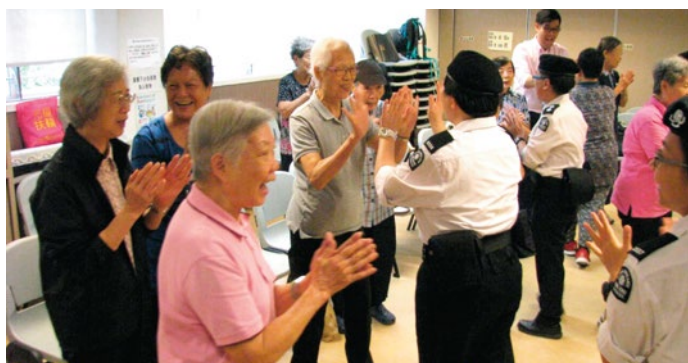
2014年10月4日·明愛鄭承峰長者社區中心(深水埗)