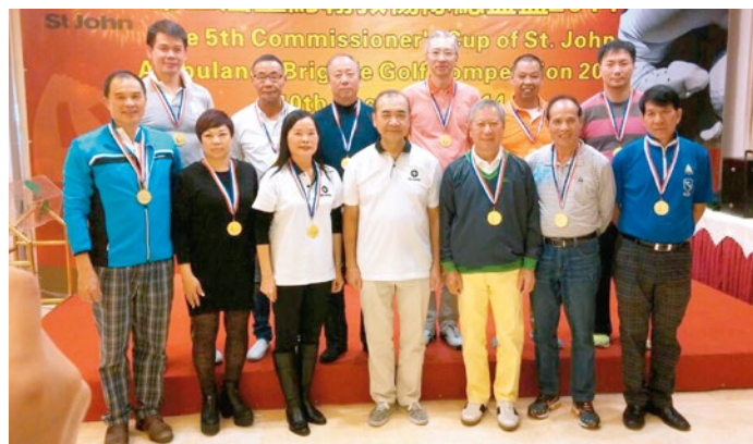
第五屆總監盃高爾夫球比賽已於 2014 年12月10日假東莞鳳凰山高爾夫球場舉行。新界總區再接再厲奪得冠軍殊榮。