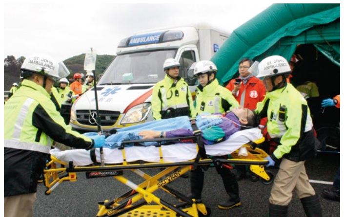
◀聖約翰救傷隊隊員及救護車運送傷者前往醫院▶