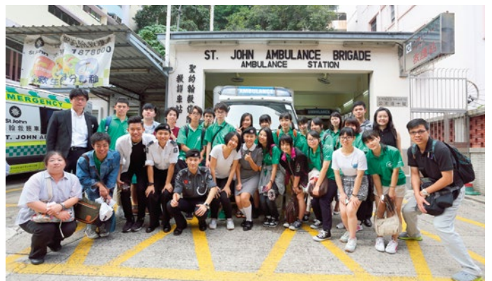
參觀聖約翰救護站

能夠以香港聖約翰救傷隊少青團的身份參與此計劃，我感到十分榮幸。在短短的八天當中，雖然大家相處的時間只是約一星期，但日本人的真情招待，好客之道的確感動人心，他們每一分每一秒為你著想的那一份真情，真的深深刻劃在我心。