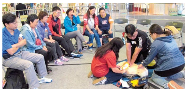
參加者正在練習去顫法