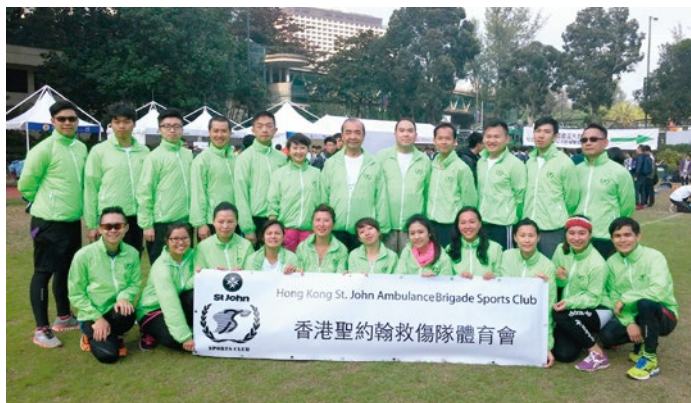
馬總監推動救傷隊積極參加體育活動

「現時香港老弱傷健人士的專用交通工具嚴重不足，不良於行的病人要往返醫療機構時，很多時是求助無門，聖約翰救傷隊有豐富的救護車服務經驗，在緊急救護服務及非緊急救護/轉運服務均積極參與，隊員都充滿愛心，以助人為快樂之本，問題只在於運作經費、建設架構、政府意向及行政管理方面，如果社會需要我們幫手，我看不到有甚麼理由我們會拒絕。」馬總監果然是「醫者父母心」，作為救傷隊一份子，筆者也期望馬總監的計劃能夠悉數成真。