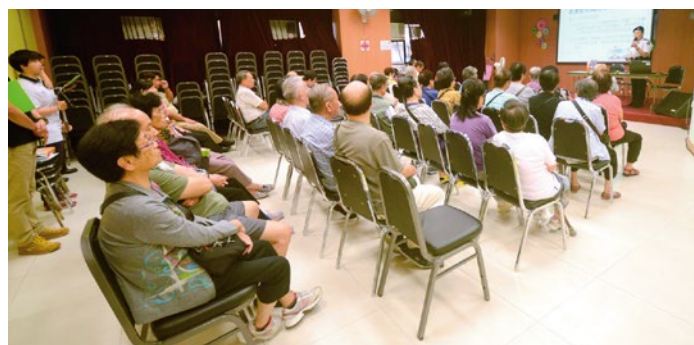
2014年10月4日香港聖公會基愛長者鄰舍中心