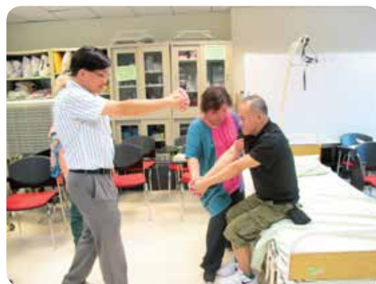
註冊物理治療師教授如何護理中風患者