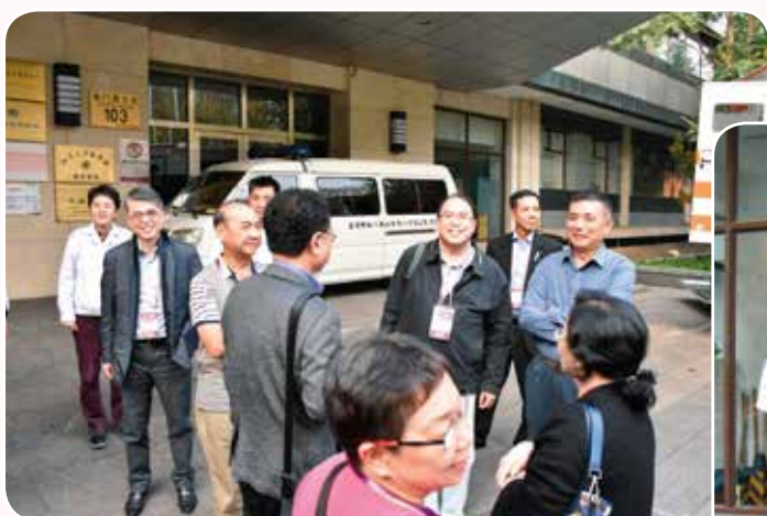
救傷隊管理層與北京急救中心領導交流