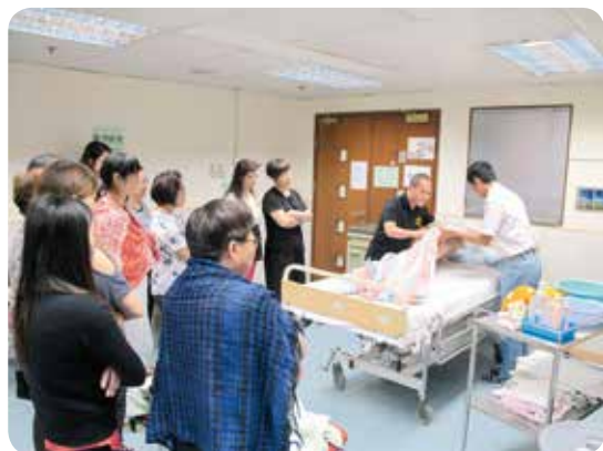
課程教授如何照顧中風的患者