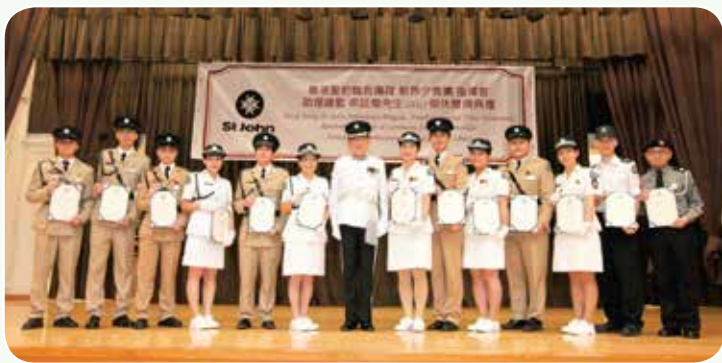
梁 Sir 與得獎者合照