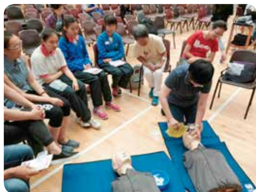
導師示範心肺復甦法