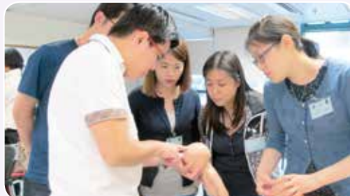
導師講解如何處理難產個案