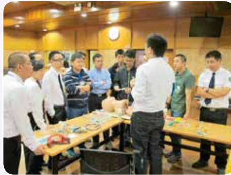
來自廣州市學員用心聆聽導師講解

廣州市急救醫療指揮中心派出8位醫師及護師，於2015年10月12至14日來港參加兩天半的院前創傷生命救援術證書課程，交流院前急救的知識及技巧。