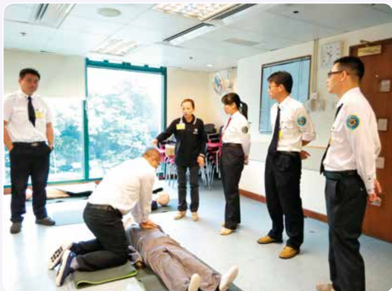
學員練習成人心肺復甦法

雲南省急救中心分別於2015年10月13日及10月20日派出兩隊，每隊6人，由中心的主治醫師、醫師、主管護師、護師及救護員組成的團隊，抵港進行成人、兒童、嬰兒心肺復甦法及哽塞處理。今年已是雲南省急救中心連續第4年派員抵港進行急救培訓，藉以交流兩地院前急救經驗，豐富彼此的知識。