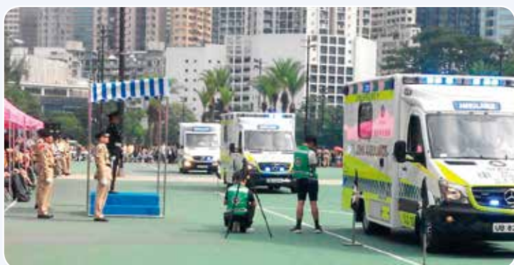
救護車列隊駛過檢閱台向馬正興總監致敬

還記得，總監在會操上致辭時表示，他深信人才是機構及團隊裡最重要的基礎。救傷隊經歷了一百年，是世世代代各級前輩造就出來的。能夠成為這支優秀團隊的領袖，肩負起救傷隊「為人類服務」的使命，實在是他的榮耀。