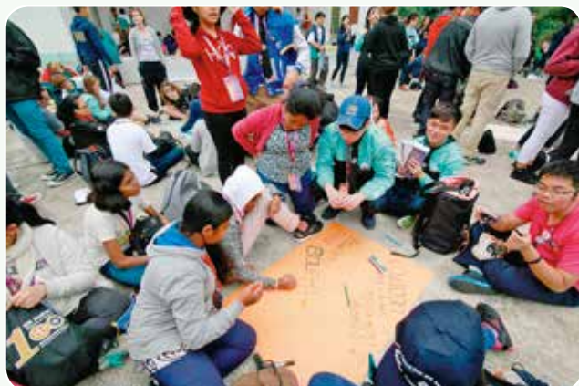
參加交流營少青團隊員投入各項活動

交流未止於香港文化，各國營友亦有機會透過不同活動認識香港聖約翰救傷隊。除了參與於旺角大球場舉行的救傷隊百周年大匯演，籌委會亦安排營友參觀位於港島及九龍的總區總部、香港聖約翰大廈、救護車服務控制中心、救護車裝備及支隊交流探訪活動等等。