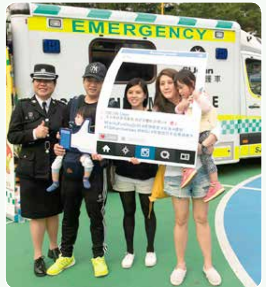
救護車成為拍照最佳背景

透過健康檢查、攤位遊戲、救護車展示、消防設備展覽、親子競技遊戲及綜合表演等節目，讓市民有機會學習更多急救和保健的知識，同時亦希望喚起大家重視個人及家庭的關愛意識，攜手鼓勵社會大眾重視家庭、推廣愛家庭及開心家庭的文​​化，讓家人互相關心，建立關愛精神，達到家庭和諧，社區融洽，宣揚「愛與關懷」的重要及「家給您力量」之信息。