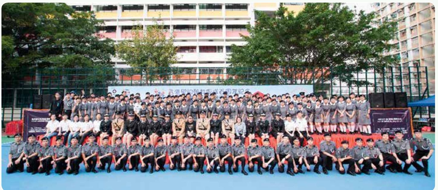
少青團長官及隊員大合照