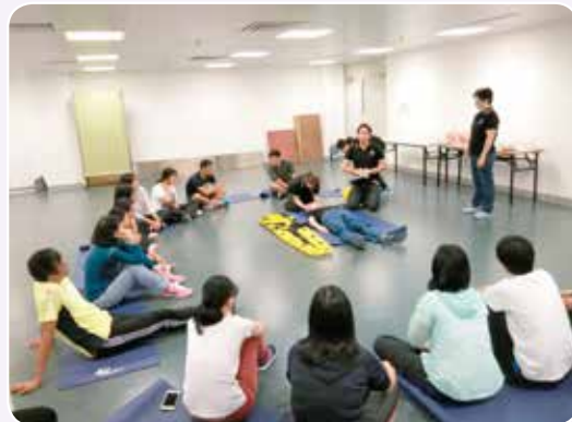
導師講解如何固定脊椎