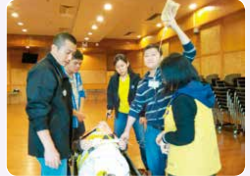
課程以實際操作為主