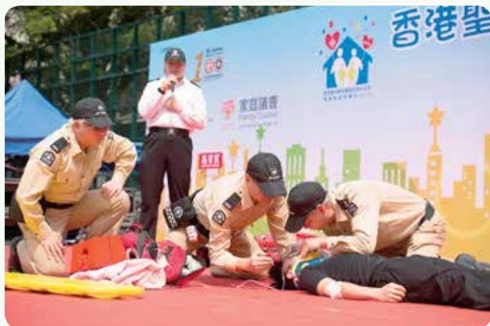
隊員示範急救技術

活動當日天氣晴朗，各籌委會成員、當值長官和隊員與及協辦機構人員均一早到達會場，進行佈置和最後安排工作，務求將所有準備工作達到盡善盡美。本隊的多個總區和部門亦有到場，以展覽、示範或舞台表演等，為在場人士詳細介紹香港聖約翰救傷隊所提供的服務、活動、訓練和推廣急救知識的重要性。