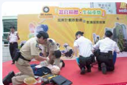
隊員示範急救技術