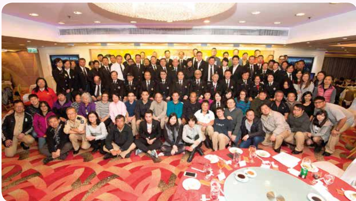
晚上聯歡會氣氛熱烈