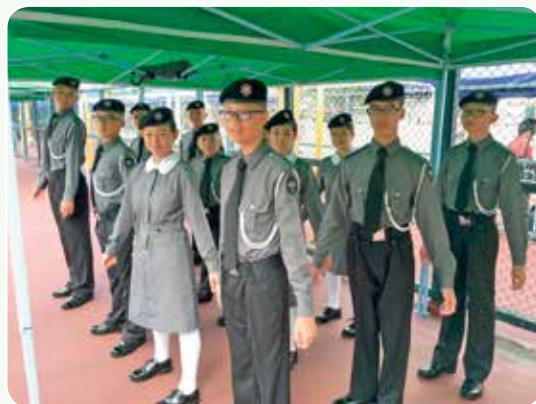
參加成立典禮會操的隊員精神奕奕