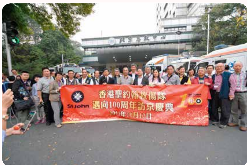
聖約翰救傷隊人員參觀北京急救中心

2016年是香港聖約翰救傷隊服務香港一世紀誌慶，為了讓救傷隊同寅緬懷先賢的貢獻，及籌劃新世紀的工作，救傷隊舉辦多項跨年的百周年慶祝活動，首項慶祝活動「香港聖約翰救傷隊百年慶典之邁向100北京慶祝會」，已於2015年10月17日在北京全國政協禮堂順利舉行，香港聖約翰救傷隊總監及一眾管理層、各級會長、長官、醫官、隊員超過140人到北京參與慶祝會，連同來自全國急救中心及衛計委官員共130人，出席嘉賓逾三百人。