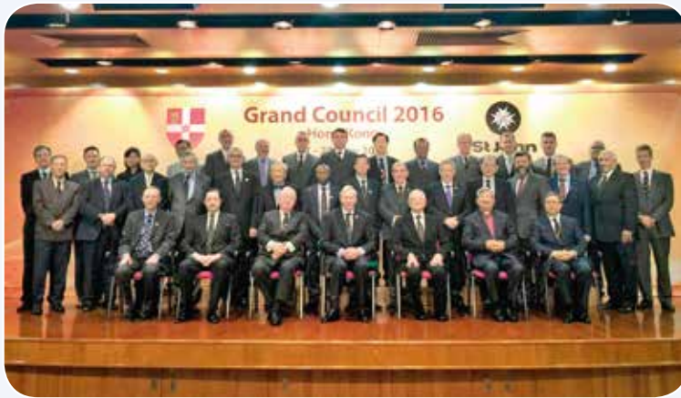
參與會議各國代表合照

聖約翰最高領袖告羅士打公爵 (HRH The Duke of Gloucester KG GCVO)、最高決策小組成員、十二個來自全球的議院及組織包括：澳洲、加拿大、英國、肯亞、新西蘭、英格蘭、新加坡、南非、美國、威爾斯，以及馬來西亞和聖約翰眼科醫院代表一同出席是次會議。各代表均對不同的議題及政策作出積極的參與及討論。