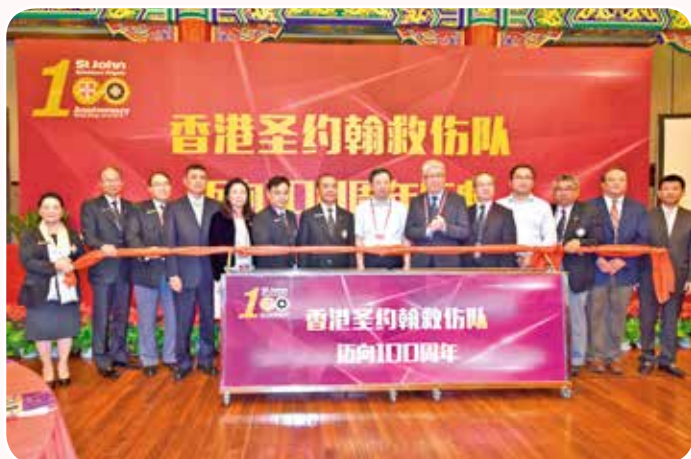
主禮嘉賓進行亮燈儀式