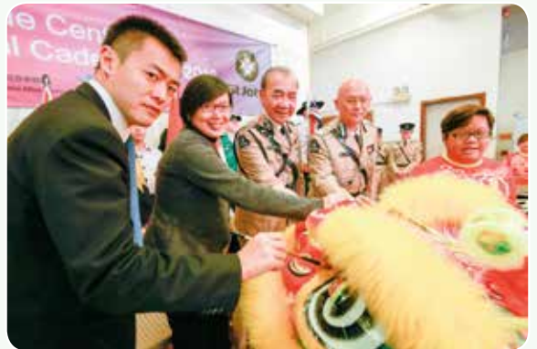
主禮嘉賓為醒獅點睛

百周年國際青年交流營活動緊湊而豐富，當中亦少不得重頭戲之一 International Cadet Championships。經過一整天的龍爭虎鬥，各參賽隊伍於七大競賽項目當中各有千秋、均表現優秀，最終由紐西蘭隊蟬聯全場總冠軍，而澳洲隊及加拿大隊分別奪得亞軍及季軍。香港隊亦創佳績，於個人急救、雙人家居護理兩項目獲獎，更於步操項目奪冠，成為最佳步操隊伍