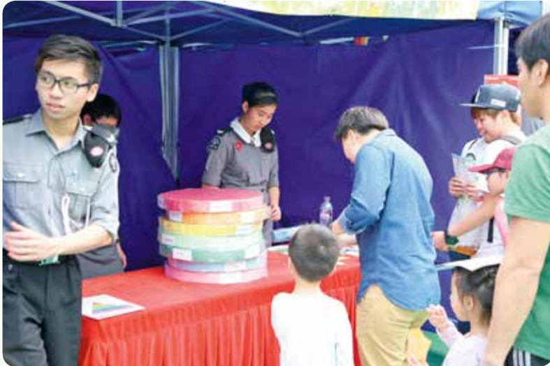
會場設有遊戲攤位