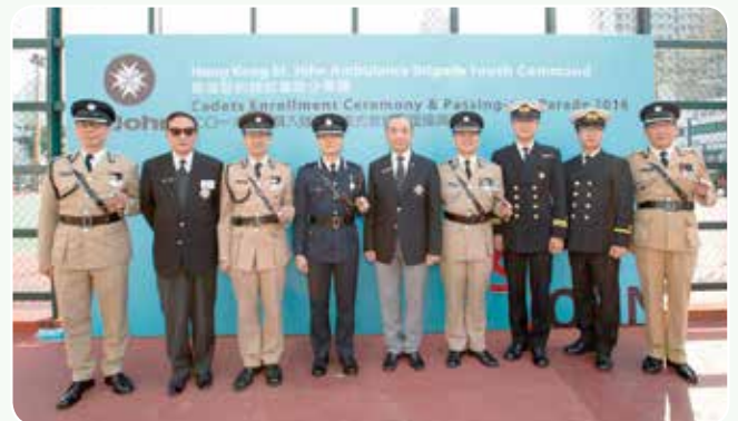
救傷隊總監及友好制服團體代表合照

去年的少青團入隊宣誓儀式暨結業閱操已在2016年3月27日於九龍長沙灣遊樂場順利完成。當天我們有幸邀請到香港警務處西九龍總區指揮官助理警務處長余達松先生為閱操典禮的主禮嘉賓，檢閱由新入隊的少青團隊員組成的閱操隊伍，並向新入隊的少青團隊員代表頒發急救證書。各新入隊的少青團隊員在主禮嘉賓、各界來賓和救傷隊的會長及長官的見證下，在高級助理總監（少青事務）范強醫生的監誓下完成宣誓，正式成為聖約翰救傷隊少青團隊員。