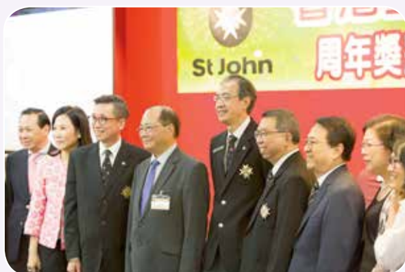
救傷會總監鍾展鴻醫生、救傷會副總監李家仁醫生、以及各位嘉賓一起歡迎合吳克儉局長