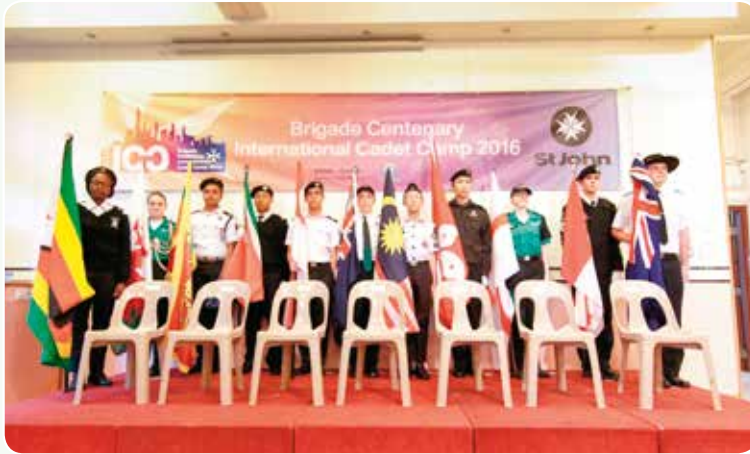
來自各國少青團隊員持旗合照