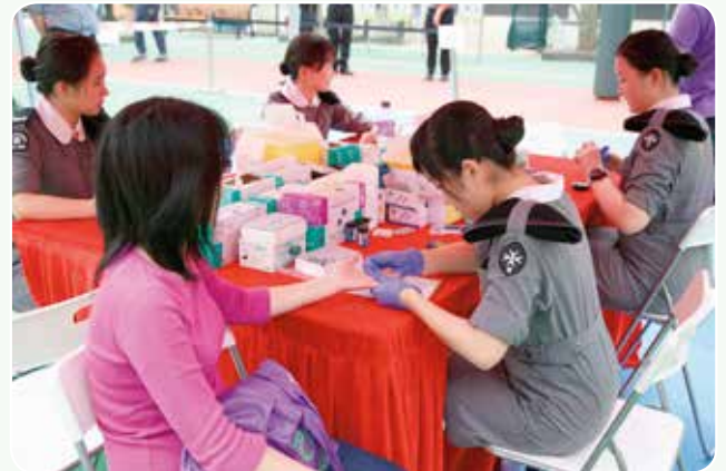
少青團員為參加市民健康檢查

透過健康檢查、攤位遊戲、救護車展示、消防設備展覽、親子競技遊戲及綜合表演等節目，讓市民有機會學習更多急救和保健的知識，同時亦希望喚起大家重視個人及家庭的關愛意識，攜手鼓勵社會大眾重視家庭、推廣愛家庭及開心家庭的文​​化，讓家人互相關心，建立關愛精神，達到家庭和諧，社區融洽，宣揚「愛與關懷」的重要及「家給您力量」之信息。