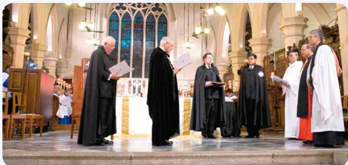
告羅士打公爵頒授勳銜