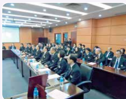
中山市人民政府西區辦事處介紹中山(西區)中醫健康養生基地及西區社會事業發展的情況