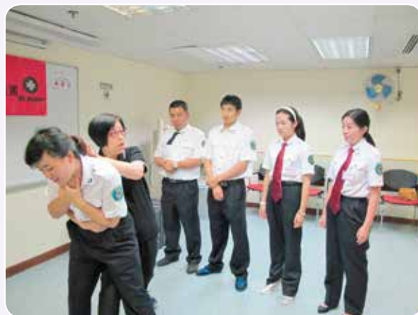
導師講解如何處理哽塞