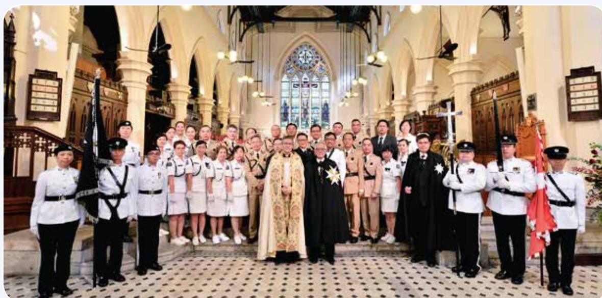
莫禮富議長與授勳人士合照