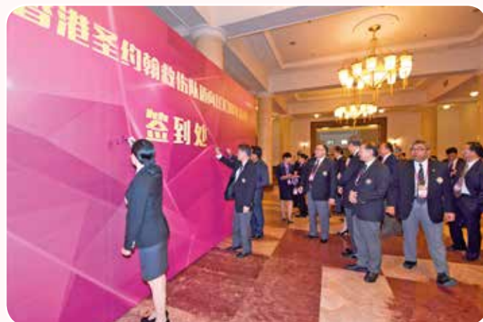
出席慶祝會嘉賓在政協禮堂地下簽到處簽名