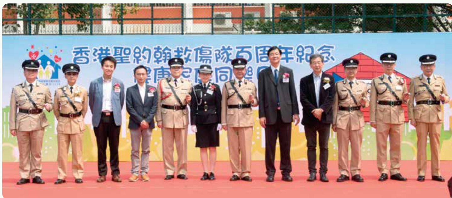
救傷隊管理層與主禮嘉賓合照