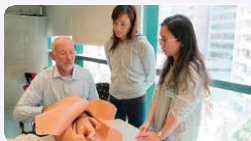
在職醫護人員學習及實踐緊急接生技巧