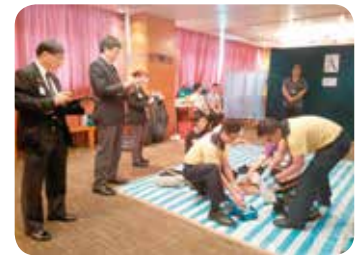
港鐵兩隊來自不同部門的職員正進行比賽

急救比賽於2015年5月15日假港鐵火炭車廠進行，當天港鐵各部門分別派出23隊參賽。在急症科專科醫生周志偉醫生及兩位助理訓練經理帶領下，分別派出4位急救學講師為比賽隊伍進行評核。為了增加個案的真實感，特別邀請了2位導師為模擬傷者化妝。