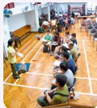
學員用心聆聽講師講解