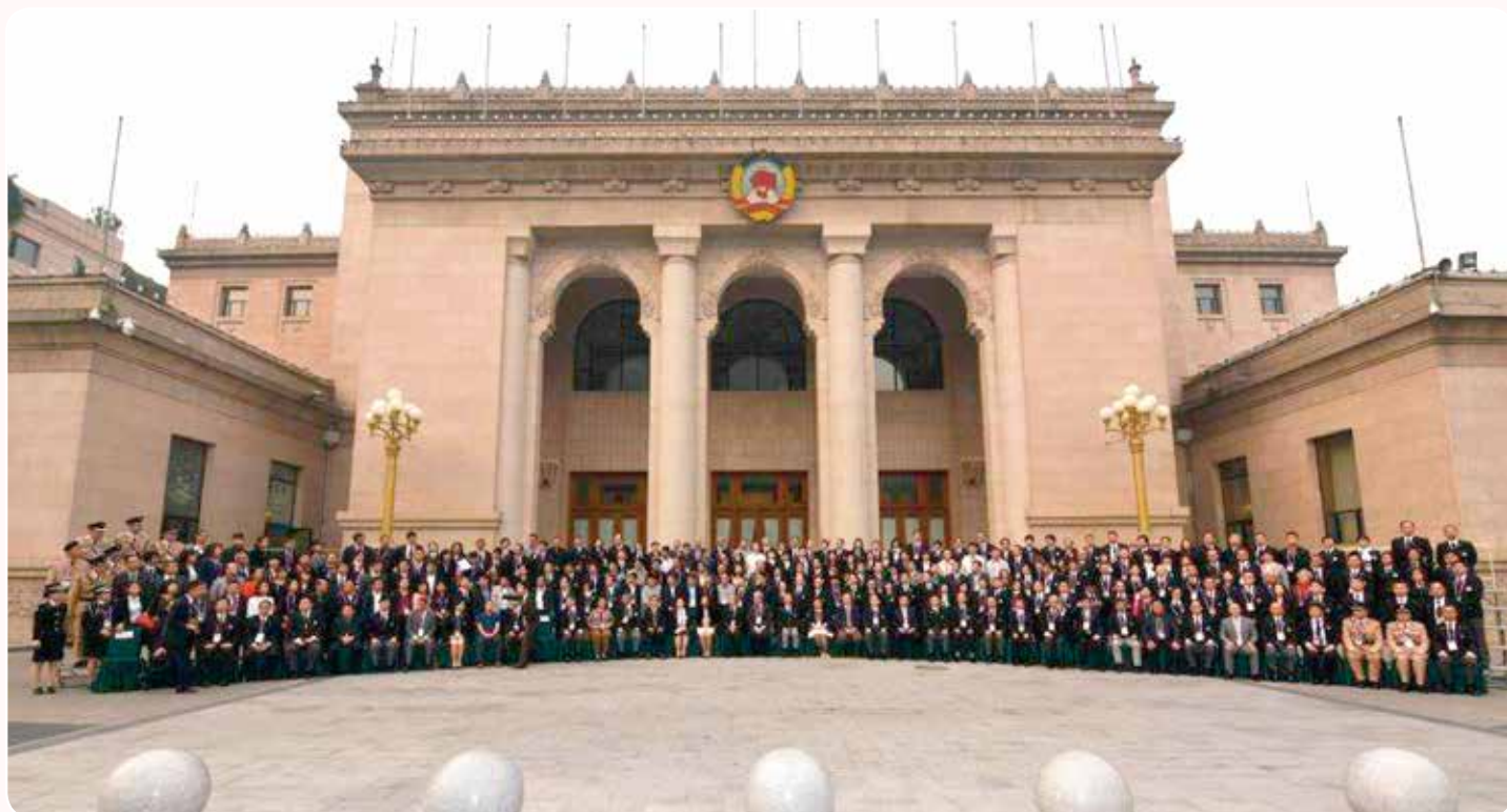
參加北京慶祝會嘉賓在全國政協禮堂外合照