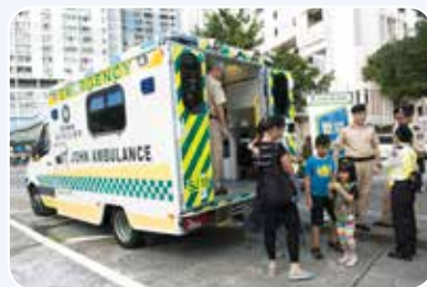
救護車設備展覽吸引市民參觀