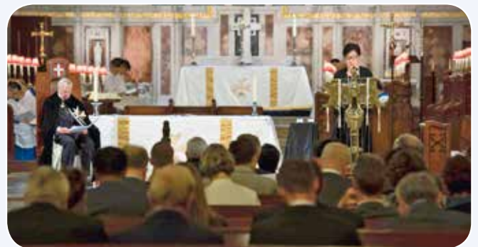
頒授儀式在聖約翰座堂舉行