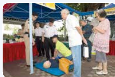
讓市民體驗 CPR 操作

在簡單而隆重的啟動儀式之後，大會安排了多場的樂隊表演及現場急救示範。由隊員扮演踏單車跌倒的傷者，其他隊員接報到場作出適切的救治。也有心肺復甦法、心臟去顫法的示範和救護車展覽，令市民深入了解救傷隊隊員日常的工作情況。活動場地同時設有多個基本健康檢查的攤位，為坊眾們檢查血壓、血糖、身高及體重指標，由護士長官講解及提供保持健康的建議。整天的活動節目十分豐富，吸引不少區內居民到場參與，基本上達到推廣器官捐贈、健康生活的知識，亦同時加深了區內民眾對救傷隊的認識。參與工作的長官和隊員都得到愉快的體驗。