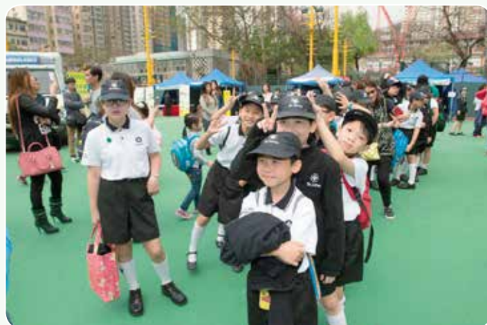
小約翰團成員參加活動