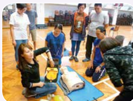
導師講解去顫器的操作

為了推廣「自動體外心臟去纖維性顫動法」(去顫法)予市民，黃大仙區健康安全城市今年邀請聖約翰救傷會合辦「成人心肺復甦法(CPR)及去顫法(AED)證書課程」，希望藉此向區內市民推廣急救知識，以提高心臟病患者的存活率。連續十班之六小時課程已於2015年9月30日至10月31日期間，假黃大仙區內不同的社區中心舉行，總共培訓了接近300名市民學習心肺復甦法及去顫法。