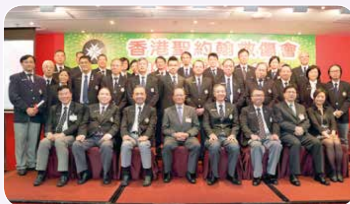
2015年講師勤奮獎-金獎講師