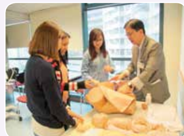
學員用心聆聽導師講解