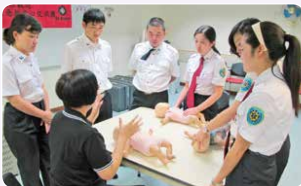
導師講解嬰兒心肺復甦法