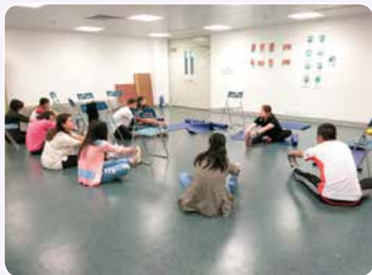
導師指導學員進行伸展運動

眾導師透過講解運動急救的理論及示範各項實習，包括運動貼紮、伸展運動、抽筋處理、傷者檢查、脊椎固定及氣道處理，以提昇預防運動受傷的意識，以及認識如何處理運動受傷，以減少運動受傷帶來的影響。學員在緊密的訓練下，順利完成兩天的課程。