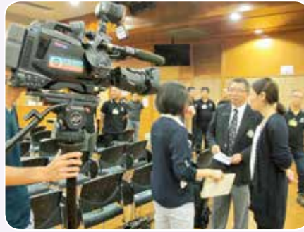
救傷會副總監李家仁醫生接受傳媒訪問