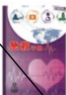
First Aid Manual (Chinese Edition) 急救手冊 (中文版)

單價: HK$ 80.00 運費: HK$ 0.00 需要數量: 1 剩餘數量: 79776