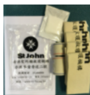
Bandages Pack 繃帶包

單價: HK$ 38.00 運費: HK$ 0.00 需要數量: 1 剩餘數量: 973018