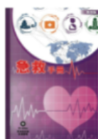
First Aid Manual (Chinese Edition) 急救手冊 (中文版)

單價: HK$ 80.00 運費: HK$ 0.00 需要數量: 1 剩餘數量: 79776