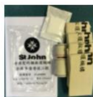
Bandages Pack 繃帶包

單價: HK$ 38.00 運費: HK$ 0.00 需要數量: 1 剩餘數量: 973018