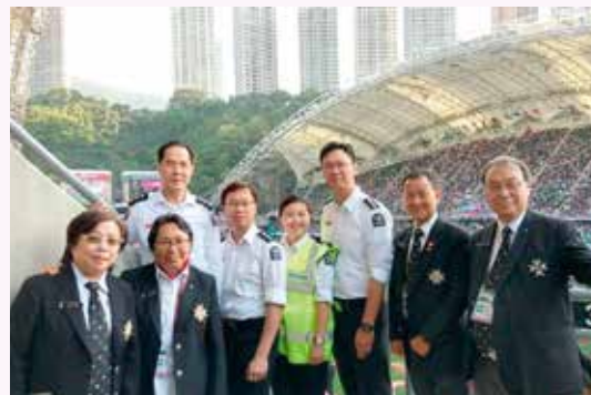
高級長官與部份當值醫官在會場合照