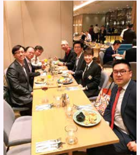
4月25日，由三至四人的小組漸凝聚成一大團人的交流