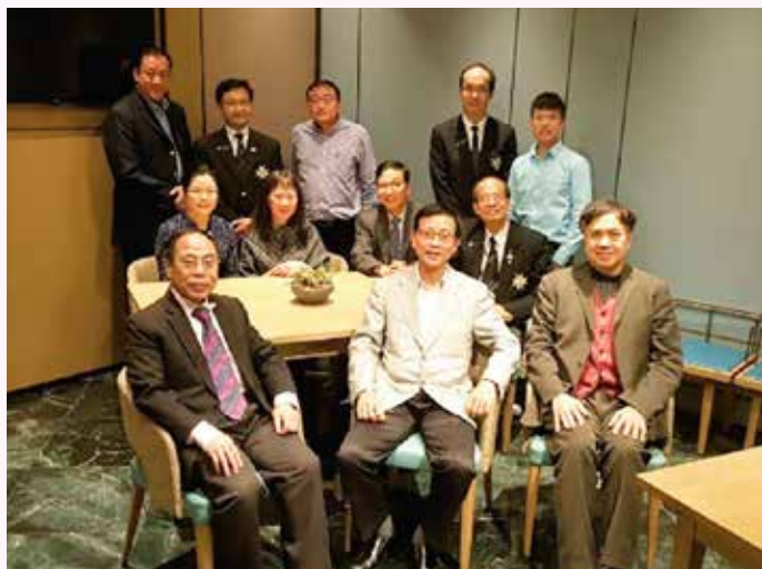
於3月27日舉行第一次聚會，人數雖然不多， 摯誠的交談十分融洽

由於安排時間略短，而這項是新的活動項目，第一天的出席人數偏低，只有12人。幸好我們繼續不斷努力宣傳，連續多出幾封電郵提示，加上有幾位總監督（醫官）和高級監督（醫官）的幫助下，參加人數