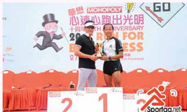
27.5.2018 心連心跑出光明 - 10K 男子個人公開組 季軍