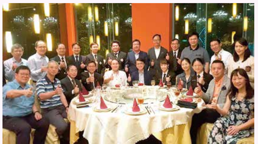
潘總監和廖副總監參與5月2日的聚會