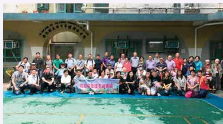
義工與院友大合照