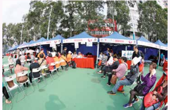
長者正輪候健康檢查