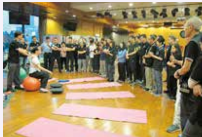
運動急救專修課程更新工作坊

「運動急救專修課程」自 2008 年首次推出至今已十年。課程從構思、籌備、策劃至具體推行，均有賴一眾運動醫學小組的骨科醫生、急症科醫生及物理治療師的積極參與。去年出版的運動急救手冊亦令課程的內容更加豐富。回顧十年，課程不但提升了學員預防運動受傷的意識，也讓學員學懂處理運動所引致的傷患。