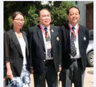
與北京衛計委官員合照