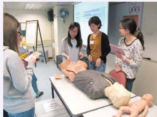
學員學習處理難產個案

為期兩天的課程分別於 2018 年 4 月 10 至 11 日、12 至 13 日以及 16 至 17 日假聖約翰大廳舉行。今年有超過 100 名醫生及護士參加課程，參加者透過導師講解理論及以情景形式去認識及實踐如何在院內進行緊急接生。課程目的為提升本地前線醫護人員進行緊急接生時的應變能力，增加分娩的安全。