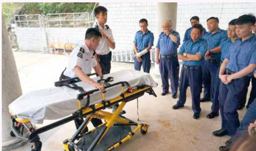
救傷隊隊員介紹救護車床使用方法

除參觀港島總區總部和特遣隊之訓練設施及行動裝備，以及民安隊港島訓練中心的設施外，訓練活動還包括救護車器材介紹及使用方法、傷者搬運方法及大型事故處理等。當日兩部隊共有100多名長官及隊員出席，兩部隊在各項訓練活動中獲益良多。