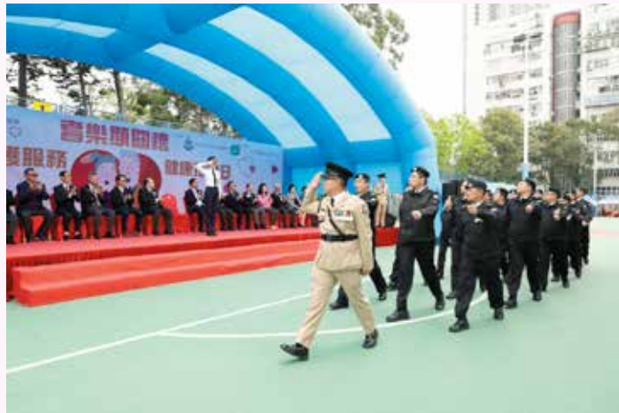
主禮嘉賓李雅麗總警司檢閱救傷隊隊員

由香港聖約翰救傷隊與九龍城耆樂警訊合辦、香港警務處九龍城警區協辦、東江集團（控股）有限公司贊助的「耆樂顯關懷·救護服務健康推廣日」已於2018年3月18日（星期日）假土瓜灣遊樂場圓滿舉行，是次活動共吸引近千名區內的市民參加。整個活動由九龍總區九龍東分區負責統籌，除了九龍總區派出超過200名長官、醫官、護士官、隊員參與檢閱、基本健康評估—血糖及膽固醇測試、視力測試、關節檢查、耳道檢查、骨質檢查、牙科檢查、西醫諮詢、攤位遊戲與展覽外，牙科總區、救護車及運輸總區、港島及九龍少青團、救傷隊樂隊等亦派員鼎力支持，尚有醫官、會長、救傷隊樂隊及地區團體也出力支持參與表演節目及中醫諮詢，令當日活動包羅萬有，透過精彩的表演節目及約七十個的健康推廣攤位，讓市民大眾了解健康生活的重要性。