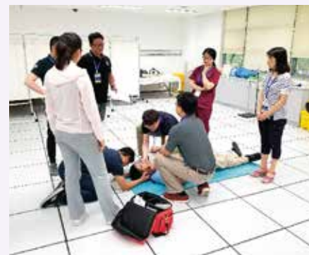
急診科醫師參加 PHTLS 證書課程 (上海)