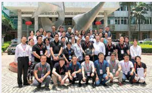
準導師與導師合照 (廣州)

PHTLS 的需要在中國內地激增，所以救傷會受美國 NAEMT 委託為上海長海醫院技能中心開拓第一班 PHTLS 證書課程，舉辦了一次連續三天的課程。於本年 5 月 30 - 31 日，舉辦證書課程，來自中國各地的 32 位醫院技能中心急診科醫師參加，最後有 29 位通過所有考試，獲頒證書；而其中有 19 位醫師獲選為導師候選人，參加了 6 月 1 日的導師課程。亦有 6 位準導師參加於 6 月 9 - 10 日在廣州舉辦的導師評核。