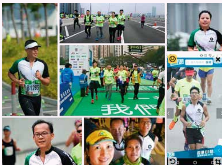
21.1.2018 渣打馬拉松 2018