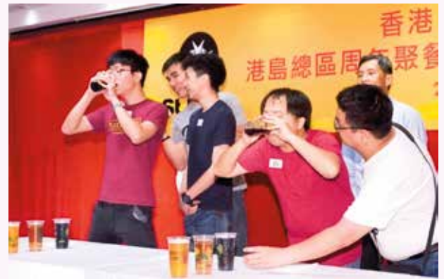
健兒們悉力以赴參加競飲大賽