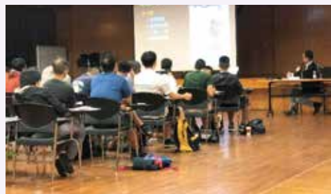
最新一期的講師訓練班已於 2018 年 9 月 3 日開課