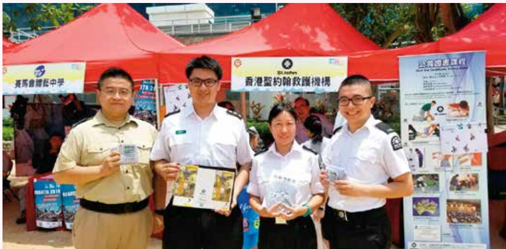
在「香港水上安全日」推廣救傷隊活動及招募隊員