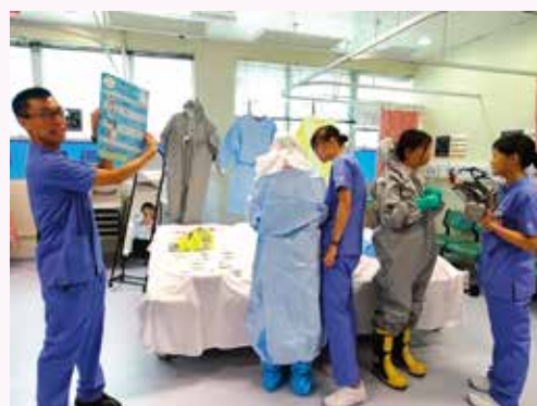
隊員在醫護人員指示下試穿不同類型之防護衣