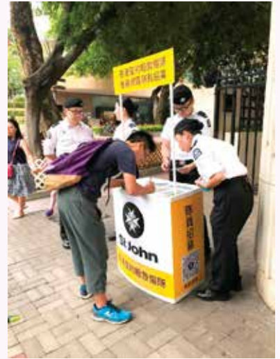
市民在招募隊員街站即場填寫入隊申請表

招募工作除了招收新隊員外，更宣傳救傷隊的服務。形式多元化，包括利用社交平台透過『港島總區面書專頁』發放招募消息、設立專用 WhatsApp 熱線查詢、在報章 / 雜誌刊登廣告、擺設街站、派發宣傳單張、製作及向市民免費派發實用招募紀念品、及在不影響急救服務的前提下在當值時推廣招募工作等。透過以上途徑，期望達致最佳的招募效果，讓更多廣大市民認識救傷隊，以吸引更多新隊員為港島總區服務，秉持聖約翰救傷隊的精神及「為人類服務」！