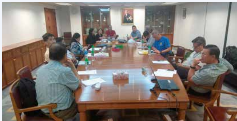
「災害醫學救援管理實務工作坊」籌備委員會在會議中

「兩岸四地災害醫學救援論壇暨工作坊」由救傷隊內地及海外分區策劃，救傷會及救傷隊各單位組成的籌備委員會負責籌備工作，工作坊由兩岸四地專家合作，以互動形式，利用多個真實災害個案，以 XVR 模擬立體場景，除理論教授之外，並加設桌上推演，防護洗消演練，讓學員動手練習，網上上載講義，讓學員預讀。