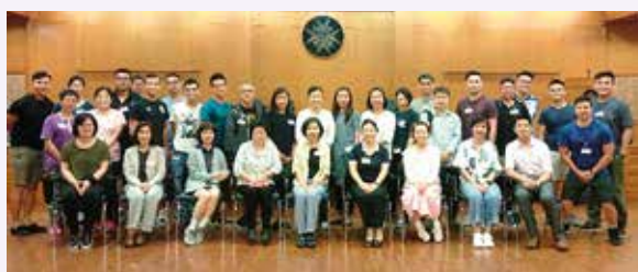
學員領取證書後合照

香港聖約翰救護機構已成功獲取由美国家庭醫師醫學學會認證的「基本產科生命支援術課程」在香港之舉辦權，2018 年上半年課程分別於 2018 年 4 月 8 日、5 月 5 日及 6 月 9 日假聖約翰大廈