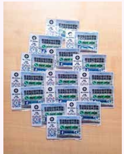
向市民免費派發的隊員招募紀念品 - 可存放電話咭及配件的八達通套