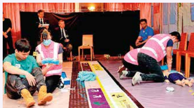
模擬傷者進行比賽