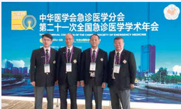
香港聖約翰救護機構參加會議代表