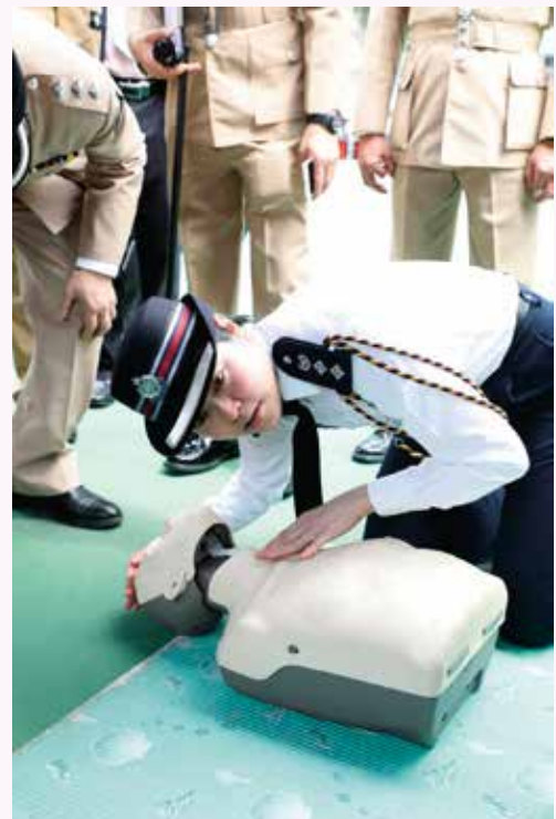
主禮嘉賓李雅麗總警司練習心肺復甦法