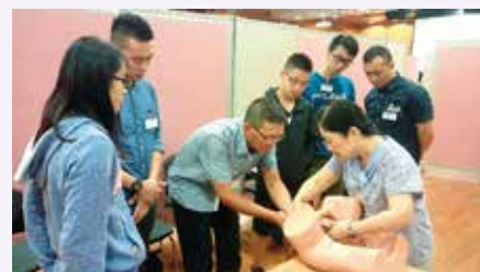
婦產科資深護士講解產科知識

舉行。參加者可以認識正常分娩及產科急症，經導師講解理論及帶領分組練習後，讓參加者能掌握正常分娩及圍產期的緊急情況。成功通過筆試及實習試的參加者可獲頒發一張有效期 5 年的證書。