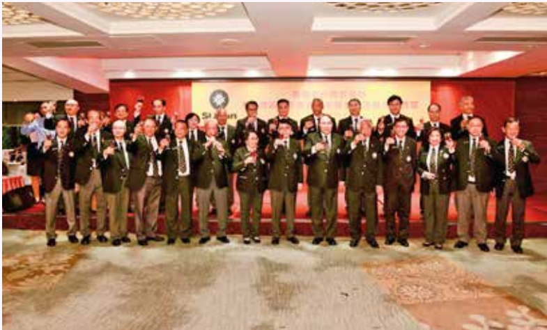
救傷隊高級長官與港島總區各單位代表向各來賓祝酒。