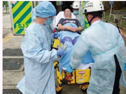
傷者送達北區醫院進行輻射感染測試

當日於演習結束後，北區醫院急症室醫護人員更安排了特別訓練予救傷隊長官及隊員。內容包括講解穿著不同類型防護衣方法、如何針對傷病者的徵狀給予適當的照料和處理法，並安排參觀急症室R房所有急救器材。各長官及隊員均能在是次演練和訓練中獲得寶貴的經驗和知識。