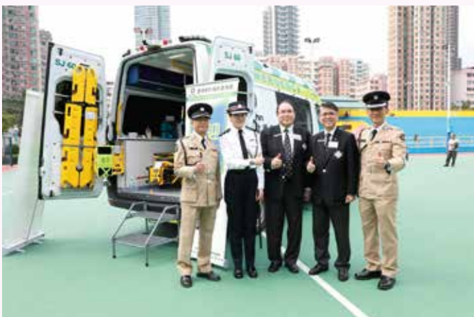
主禮嘉賓李雅麗總警司在救護車前留影