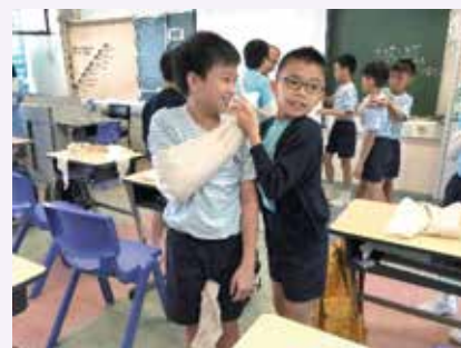
小五學生於課堂上練習基本包紮技巧

為了讓高小學生掌握基本急救的知識及技巧，增強在意外 / 事故時的求生能力，香港聖約翰救護機構推出 16 小時的免費「學校急救課程計劃 (小學)」予本港小五小六學生。課程以互動及持續評估方式進行 (毋需考試)，每位參加學生均可免費獲得「基本急救課程手冊」及兒童繃帶包乙套。