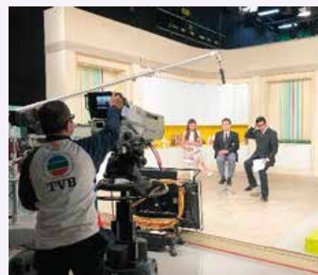
急救學及去顫法顧問列就雄醫生講解預防老人家居意外及心肺復甦法去顫法