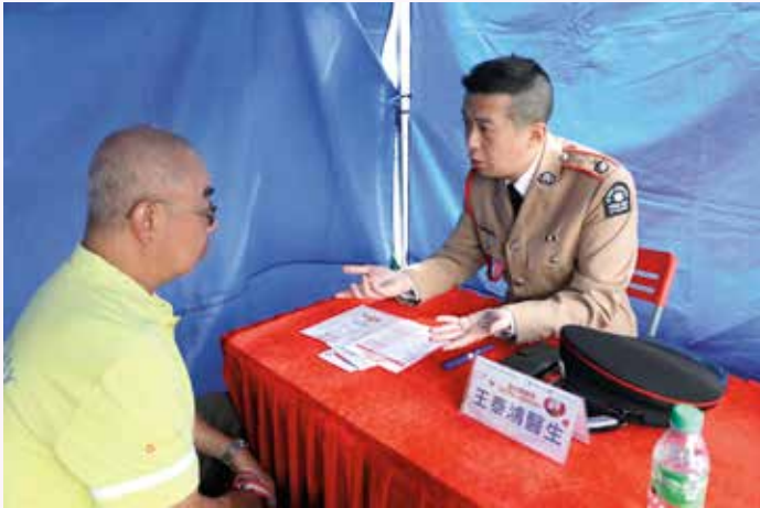
九龍總區的醫官為市民提供健康諮詢