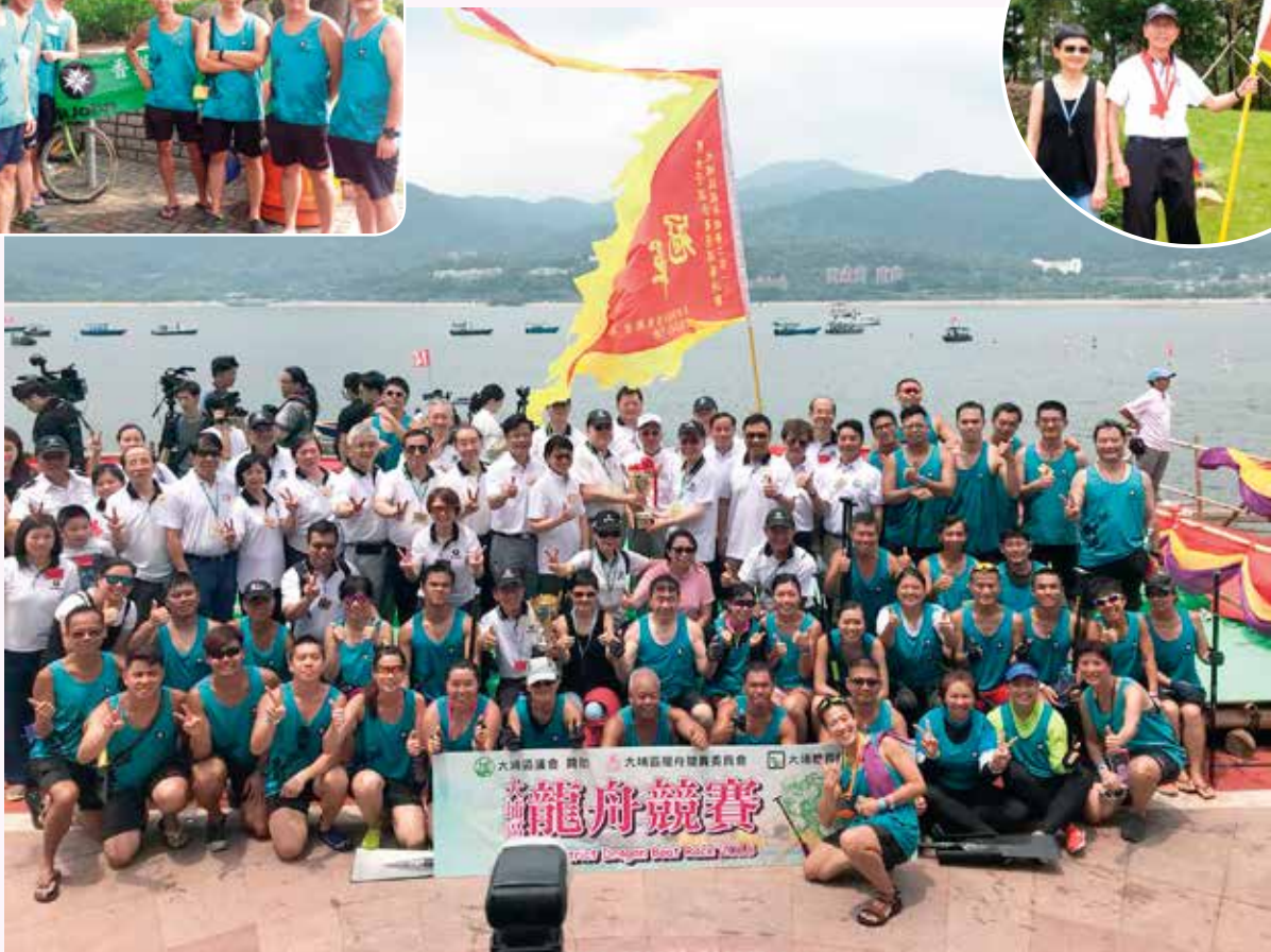
6月18日端午節 大埔混合中龍優異決賽冠軍