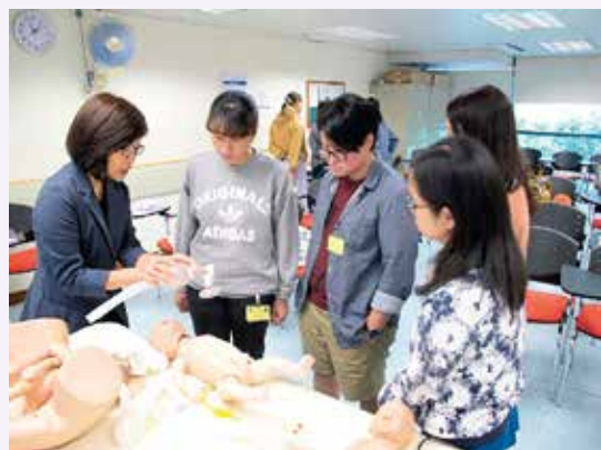
導師講解接生技巧