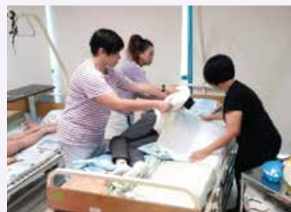
學員練習實務護理技巧

本課程與僱員再培訓局 (ERB) 合辦，讓學員掌握擔任醫院支援人員 (臨床病人服務) 的知識、技巧及溝通能力。並且協助學員建立信心，提高就業能力，以應付行業的入職要求。課程內容包括理論及實習，例如：醫護支援人員的角色和責任、人體基本結構、功能及病理認知、起居照顧技巧、病人護理技巧、藥物認識、環境衛生及安全、感染控制，以及個人素養及求職技巧等。