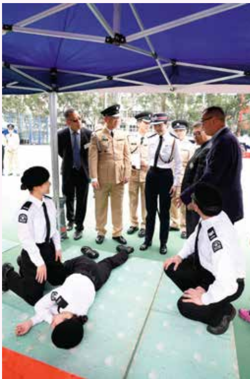
隊員向各嘉賓示範復原臥式