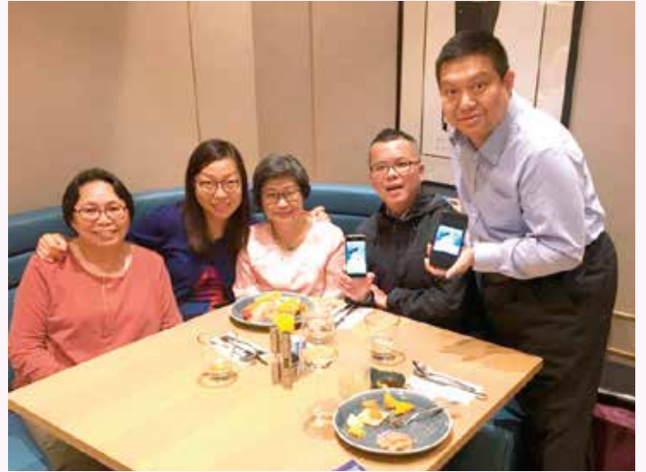
各人渡過了一個愉快的晚上