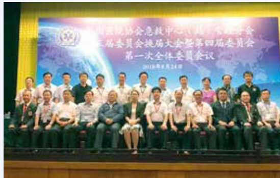
中國醫院協會急救中心(站) 管理分會第四屆委員合照