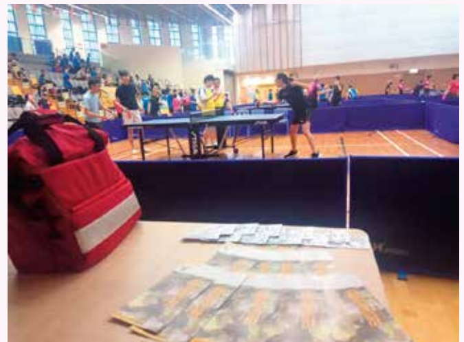
在急救站放置招募隊員單張及宣傳品