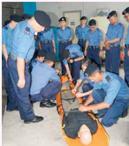
民安隊隊員實習使用卷式抬床運送傷者