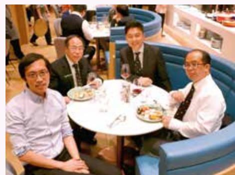
聚會以自助餐形式舉行，可以作三、四人小組討論