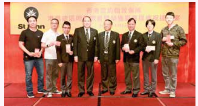
抽中現金大利是的幸運兒與抽獎嘉賓合照，笑逐顏開！