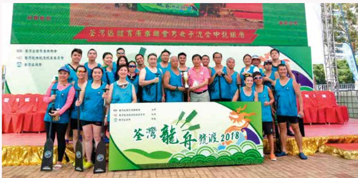
6月3日 荃灣混合中龍銀盾決賽季軍