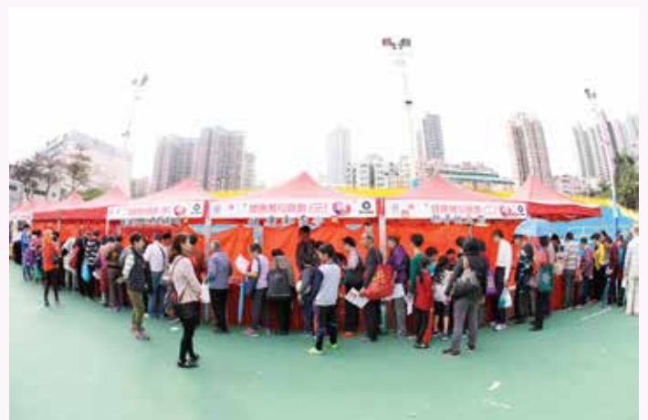
港島及九龍少青團負責之攤位遊戲