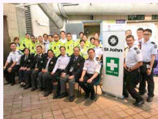
高級長官親臨探望當值人員，為各長官及隊員打氣