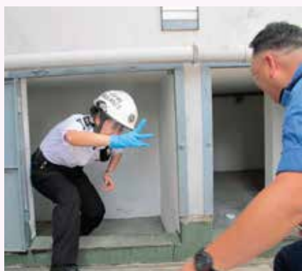
救傷隊隊員在民安隊港島訓練中心實習通過狹隘空間

香港聖約翰救傷隊港島總區特遣隊應民安隊九龍區域C中隊邀請，於2018年6月3日分別在救傷隊港島總區總部及民安隊港島訓練中心舉行全日聯合訓練活動。目的旨在使兩部隊的長官及隊員，加深了解彼此的訓練及服務，並互相交流救援及急救的知識和技巧。