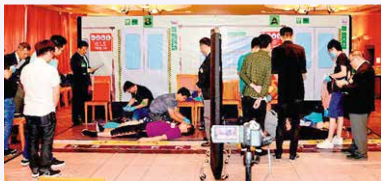
港鐵兩隊來自不同部門的職員正進行比賽

急救比賽於 2018 年 5 月 16 日假港鐵火炭大樓附建大樓進行，當天港鐵各部門分別派出 24 隊 80 人參賽。在急症科專科醫生梁展新醫生及一位助理訓練經理帶領下，分別派出 7 位急救學講師為比賽隊伍進行評核，其中兩位導師負責為模擬傷者化妝，以增加個案的真實感。