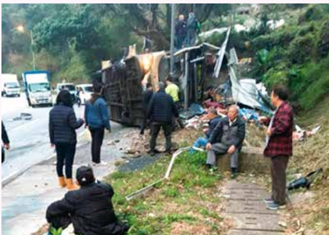
傷者正從翻側巴士爬出