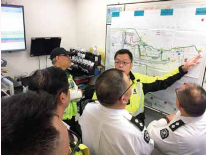
當值主管在賽事前了解賽道