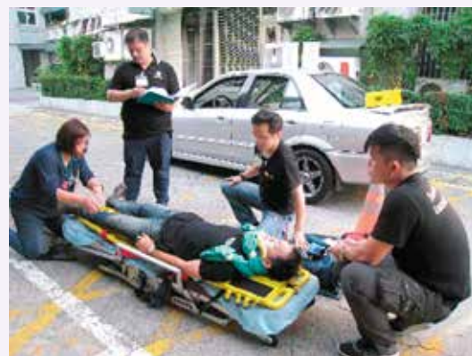
學員實習如何運送傷者