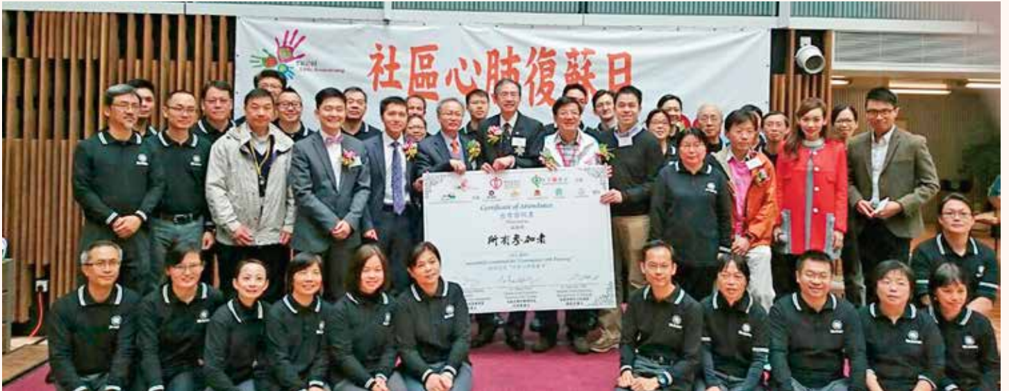
出席社區心肺復蘇日

聖約翰救護機構的座右銘是「為信念」及「為人類服務」，希望聖約翰全體同寅，本著無私奉獻的精神，救急扶危，服務社羣，以聖約翰為榮。