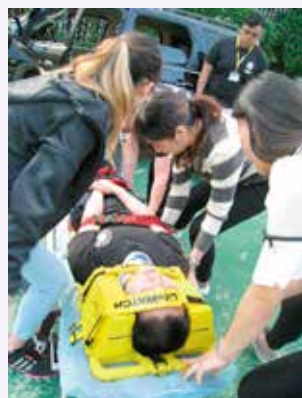
用創傷背板固定傷者

課程的地點是高雄市的一個市政會堂，兩天的課程在既嚴謹又不失輕鬆的氣氛下順利完成，學員們獲得了許多提升工作能力的知識和技能。課程中還有一個小插曲：在「快速撤離」的環節中，剛巧街上發生了一宗交通意外，台灣的 PHTLS 導師們（本身亦是全職或志願 Emergency Medical Technician）在一言不發的默契下，已經拿著急救設備和創傷背板衝往事發現場，即席示範了「初次檢傷」及相應的治療，然後把傷者交給到場的救護車。這一幕插曲比任何的演示和教學更重要，是活生生的生命教育，展現了台灣醫護人員高尚護生的情操。