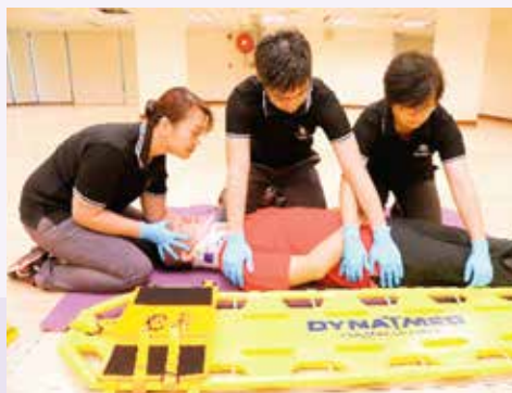
《運動急救手冊》照片拍攝過程