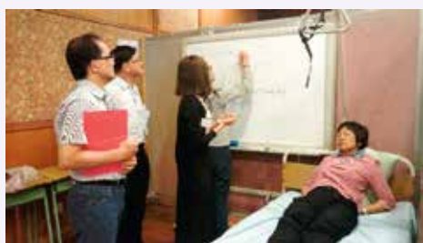
導師向學員講解課程細則