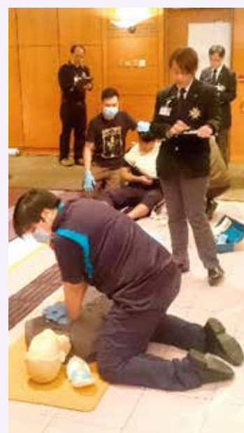
港鐵兩隊來自不同部門的職員正進行比賽