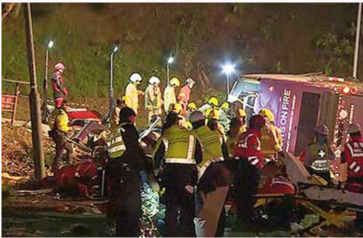
救傷隊在車禍現場協助救援