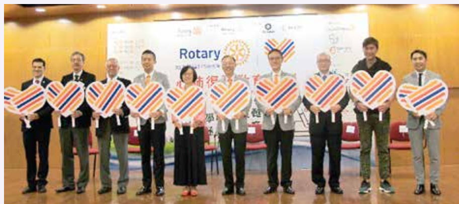
2016 年國際扶輪 3450 地區「心肺復甦教育計劃」新聞發布會