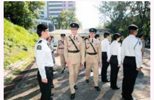
檢閱官向隊伍逐一檢閱