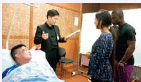
學員實習課程內容