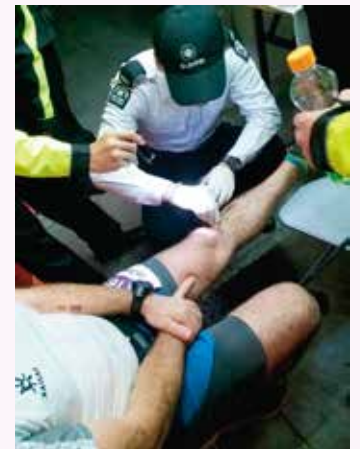
救傷隊替參賽健兒傷口處理

衷心感謝九龍東分區派出合共 112 位長官及隊員參與是次活動的急救當值服務，比賽期間共處理 407 個受傷個案，其中 2 個個案送往醫院救治。