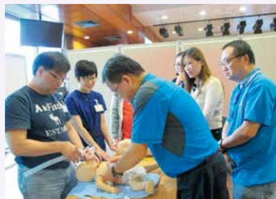
學員實習初生嬰兒的心肺復甦法