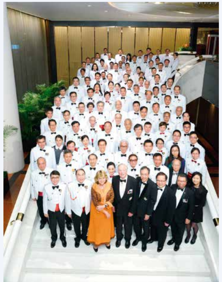
救傷隊舉行之晚宴