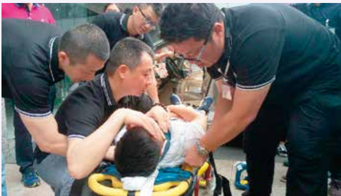
導師示範固定傷者