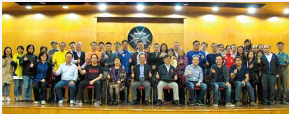
運動急救專修課程更新工作坊導師合照

為了讓導師容易掌握新出版課程手冊、課程簡報、考試內容，以及 2018 年的最新動向等，小組委員於 2017 年 11 月 1 日假聖約翰大廈，為課程導師舉辦了更新工作坊。