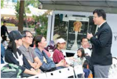
救傷隊醫官主持長者健康講座

當天的表演節目包括醫生講座、緊急應變及處理示範、家居急救常識話劇、太極拳及防跌操、單車急救隊示範、花式跳繩表演、健康檢查、展板介紹、攤位遊戲、救護車裝備展覽及急救用品介紹等，節目可謂多姿多采，為市民提供了一個既富資訊性又富娛樂性的周日。