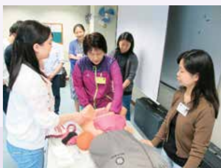
在職醫護人員學習及實踐緊急接生技巧