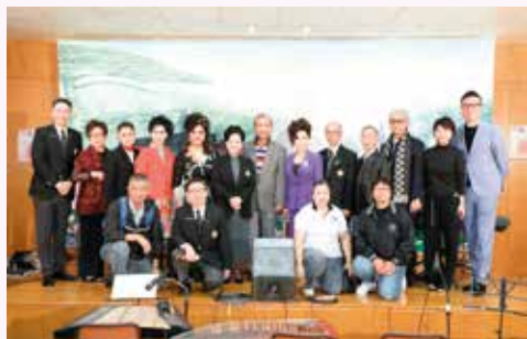
各演出者及工作人員

九龍總區會長會於 2017 年 12 月 16 日舉辦了「粵聲樂韻會知音」活動，有賴會長及長官們鼎力支持，活動得以順利完成，出席的會長及長官欣賞了各演出者的風彩及清耳悅心的歌聲，大家渡過了一個愉快的下午。