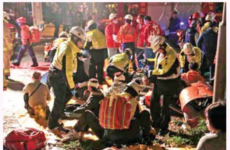
救傷隊為傷者包紮傷口