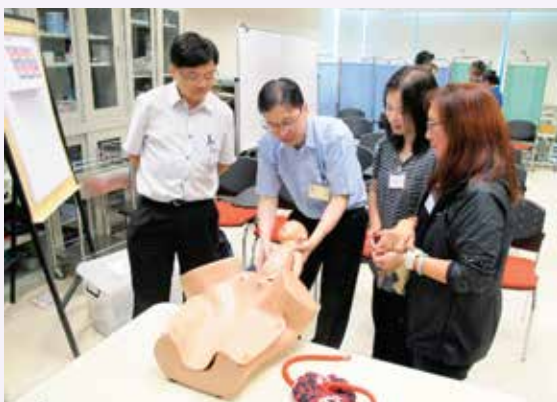
婦產科醫生教授基本產科知識