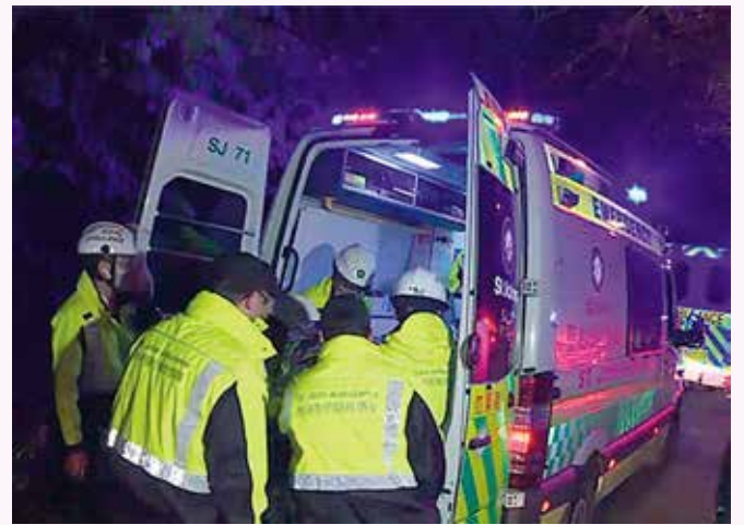
將傷者送上救護車