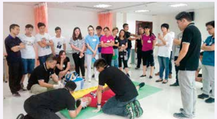
導師示範檢查傷者