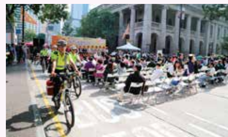
典禮開始，步操隊及單車隊進場