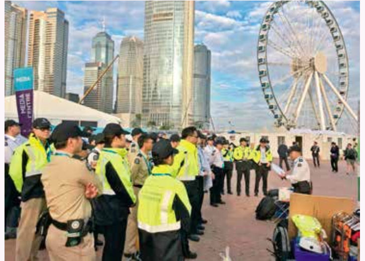
當值前舉行任務述要

在香港舉辦的第二屆電動方程式賽車在 2017 年 12 月 2-3 日假中環海濱區進行。此項賽事亦是慶祝香港特別行政區成立二十周年的其中一項活動，為旅遊事務署和香港旅遊發展局全力支持。而聖約翰救傷隊亦應邀為賽事提供急救服務。