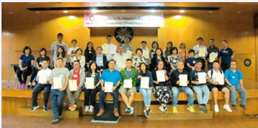
學員領取證書後合照

香港聖約翰救護機構已成功獲取由美國家庭醫師醫學會認證的「基本產科生命支援術課程」在香港之舉辦權，首兩班的課程分別於2017年6月11日及7月7日假聖約翰大廈舉行。參加者可以認識正常分娩及產科急症，經導師講解理論及帶領分組練習後，讓參加者能掌握正常分娩及圍產期的緊急情況。成功通過筆試及實習試的參加者可獲頒發一張有效期5年的證書。