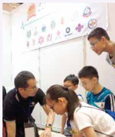
當日活動吸引了青少年學習去顫法

第六屆運動博覽於 2017 年 8 月 11 日至 13 日假香港九龍灣國際展貿中心舉行。救傷會應香港心肺復甦委員會之邀請，於 2017 年 8 月 13 日派出導師在場示範，及講解去顫法及心肺復甦法，令參加者有機會初步認識急救技術並進行練習。