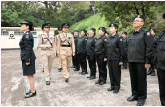
檢閱官向隊伍逐一檢閱

九龍東分區於 2017 年 12 月 17 日 (星期日) 假九龍總區總部舉行了九龍東分區檢閱暨聯歡晚會。檢閱於下午正式開始，並邀得九龍東分區分區會長齊光華先生擔任主禮嘉賓。分區轄下八個支隊的隊員早已換上全新的制服，精神抖擻地接受齊會長的檢閱。活動後，分區特別安排嘉賓移步到剛完成翻新工程的禮堂，參與聯歡晚會。是次的聯歡晚會可謂別開生面，除了有豐富的佳餚外，最特別的莫過於設有卡拉 OK 環節。各嘉賓都不忘大展歌喉，與眾同樂一番，所有出席的長官、隊員及家屬都於歌聲中、歡笑中渡過一個愉快的晚上。