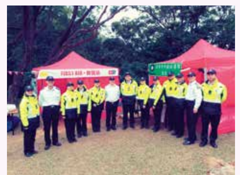
九龍支隊長官及隊員於鉛礦坳檢查站當值