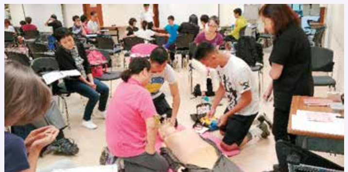
學員練習使用去顫器