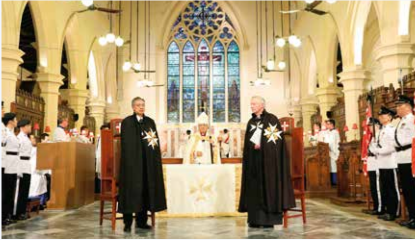
鍾醫生獲策封為聖約翰正義爵士