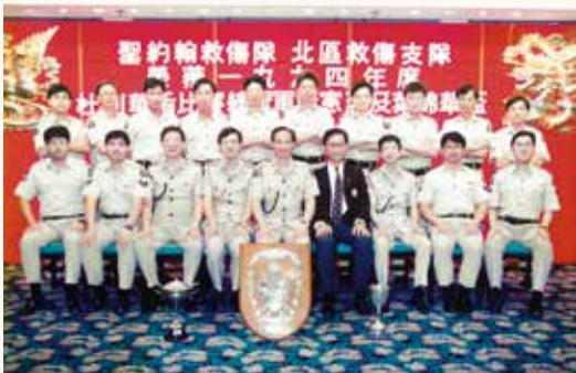
鍾醫生在聖約翰首個崗位是救傷隊北區支隊隊醫