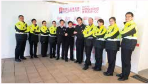
少青團長官與成人隊員一同當值合照

一年一度由新鴻基地產主辦之「新地公益垂直跑 - 勇闖香港 ICC」於 2017 年 12 月 3 日舉行。活動共有約 2,000 名參加者分別由環球貿易廣場 8 樓開始起跑至 100 樓為終點。港島總區自 2012 年開始已為該活動提供駐場急救服務。當日救傷隊共有 138 位長官及隊員當值 (包括 3 位醫官、4 位護士長官、20 位長官及 111 位隊員)，其中 3 位少青團長官、3 位見習隊領袖及 5 位少青團隊員更是首次參與其中。各當值人員分別被調派到 8 樓起點位置、3 個隔火層、100 樓終點位置及每相隔數層樓的樓梯轉角位的急救崗位，以提供適切的協助和支援。大會更致送感謝狀予聖約翰救傷隊，以感謝救傷隊在活動上提供的支援和服務。