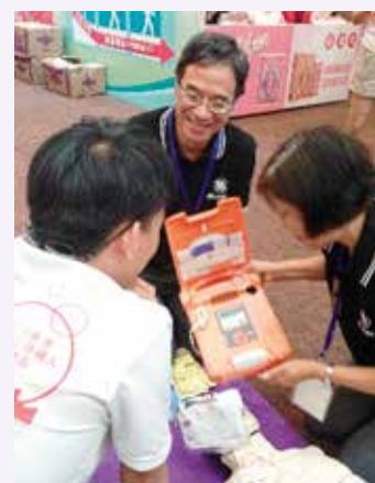
導師講解去顫器之操作