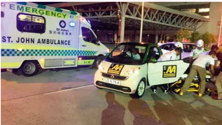
賽事前進行救援演習