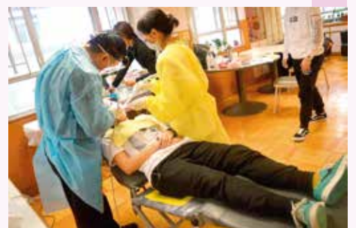
笑容重現計劃令受惠者改善生活質素