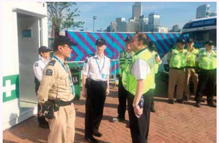
救傷隊總監巡視當值情況

此項當值由港島總區與救護車及運輸總區聯合負責。港島總區的主要職責是在場內設立五個救護站為場內觀眾提供服務；而救護車及運輸總區則負責在賽道上發生意外時，為賽車手施援，並安排 5 隊快速反應小隊為各可能發生的突發事件作緊急支援。救傷隊為此次當值每日派遣 7 部救護車及共動員超過 100 人，包括醫官、護士長官、長官及隊員。