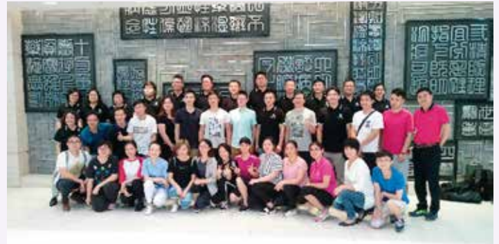
廣東省中醫院導師及學員

2017年8至10月期間，救傷會先後為廣州及台灣學員舉辦了4次院前創傷生命救援術課程，合共培訓了62名學員。其中一次在廣州廣東省中醫院舉行的培訓，學員包括主治醫師、主管護師、主治中醫師等。更匯集了中、港、台兩岸三地的院前導師一同進行團隊教學。師生們藉此機會交流院前經驗及心得，彼此也增進了不少知識及技巧。救傷會盼望可以進一步將院前課程推廣至國內及台灣，讓更多人掌握到院前救援的技術。