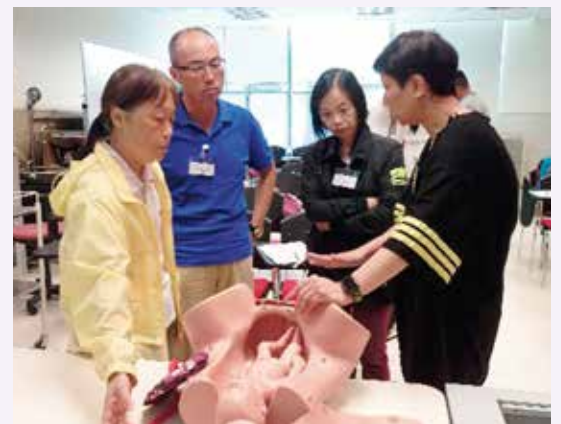
婦產科資深護士講解基本產科知識