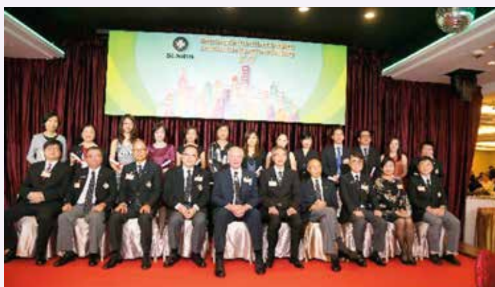
聖約翰導師 (基本產科生命支援術) 委任典禮

當晚大約有三百名嘉賓、聖約翰救護機構理事會委員、救傷會總監、救傷隊總監、救傷會總監評議會委員、委員會/小組成員、救傷隊隊員、聖約翰講師及導師等出席典禮及晚宴。