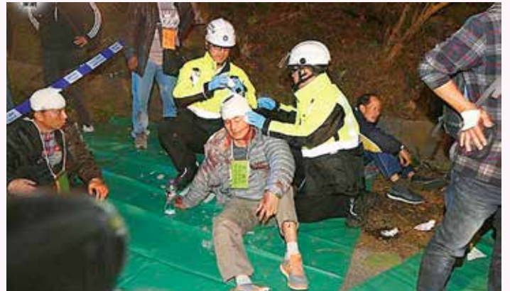
救傷隊隊員正為傷者急救

2018年2月10日下午6時13分，大埔公路近大埔區大埔尾村對開巴士站發生嚴重車禍，行走沙田馬場至大埔中心的九巴特別路線872號一輛雙層巴士，在彎位突向左翻側，將行人路上巴士站壓毀劃為平地，消防處接報一共派出超過200名消防員及救護員，出動26輛消防車、37輛救護車、1輛流動醫療車、3輛救護電單車到場救援，由於現場傷者眾多，消防處指揮中心通知聖約翰救傷隊增援。