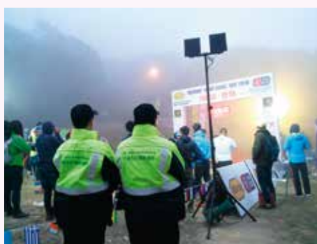
終點站為大帽山扶輪公園