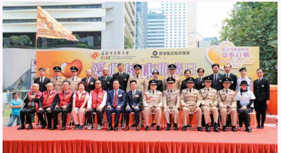
出席的嘉賓大合照