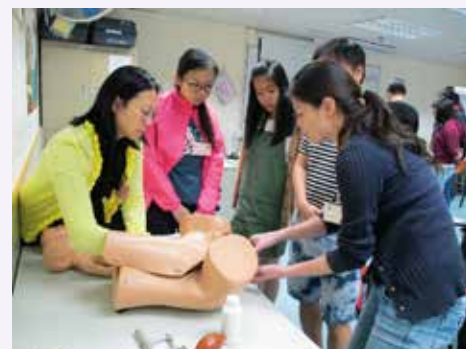
導師講解如何處理難產個案