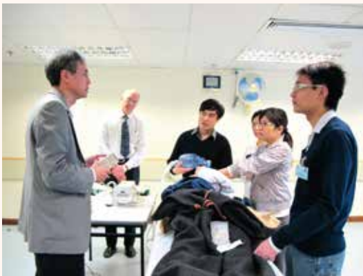
鍾醫生任救傷會總監時致力提升各項急救訓練