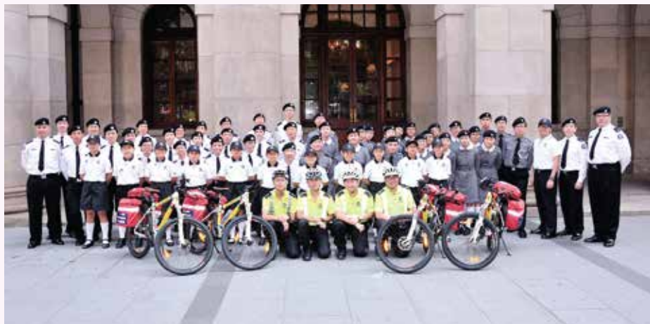
參與步操進場的人員大合照

開幕典禮由衛生署助理署長徐樂堅醫生蒞臨主禮，並聯同「愛心大使」張美妮小姐、香港聖約翰救傷隊及香港中華總商會的嘉賓一起主持健康推廣日啟動儀式。典禮過程中有聖約翰樂隊及隊員步操表演。