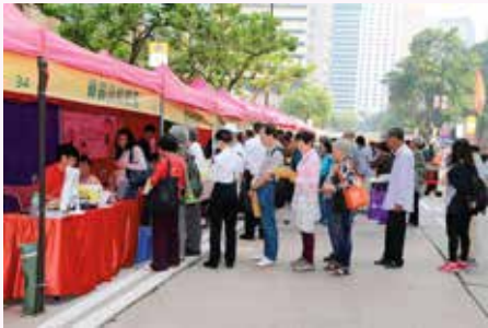
檢查骨質疏鬆的攤位人龍不絕

當天的表演節目包括醫生講座、緊急應變及處理示範、家居急救常識話劇、太極拳及防跌操、單車急救隊示範、花式跳繩表演、健康檢查、展板介紹、攤位遊戲、救護車裝備展覽及急救用品介紹等，節目可謂多姿多采，為市民提供了一個既富資訊性又富娛樂性的周日。