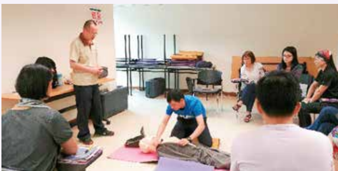
導師指導學員如何檢查脈搏

聖約翰救傷會一向致力向公眾推廣「心肺復甦法」及「去顫法」。2017年，救傷會再次獲何東爵士基金贊助2,000名免費學額予公眾人士，課程共34班，於5月至8月舉行，並以先到先得形式分配。參加者（年滿13歲）若出席率達100%，並通過考核，便可獲得「心肺復甦法」及「自動體外心臟去顫法」證書，有效期兩年。