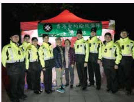
九龍總區會長為當值的長官及隊員打氣