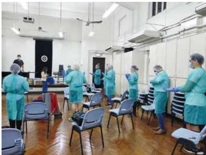
隊員學習穿卸個人保護裝備的技巧

雖然舉行工作坊期間疫情不穩，但總區內人員仍踴躍參與訓練，救護車及運輸總區共舉辦了六節工作坊，共91人出席。此外，在消防處救護總區協助下，總區大部分人員已完成「N95呼吸器面型配合測試」，以便隊員當值期間有需要時可使用合適N95呼吸器，以保障自己及他人健康。