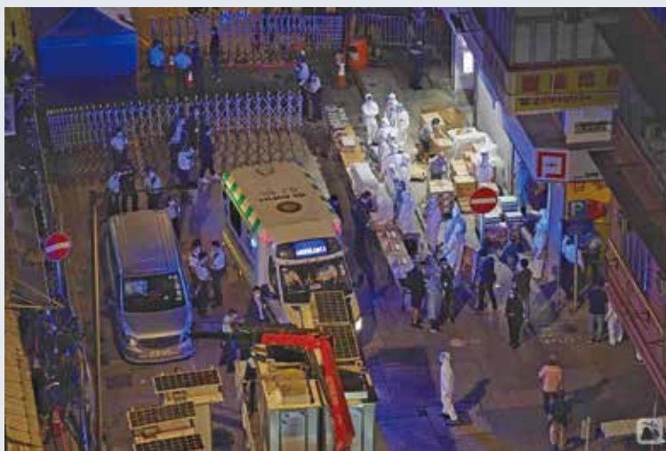
應政府要求，提供隊員及車輛運送在「受限區域」而需到急症室求醫的人士

三月下旬至四月初，本港疫情稍為舒緩，救傷隊亦逐步回復急救值勤服務。救護車及運輸總區亦同時開始回復部分急救值勤服務，包括在清明節期間，應食物及環境衛生署邀請，於北區和合石墳場提供駐場救護車服務當值，與新界總區同寅一同為有需要之市民提供緊急救護服務。