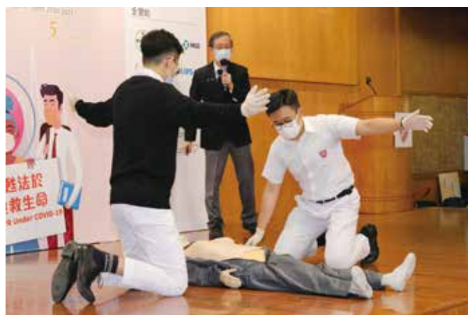
心肺復甦法及去顫法示範