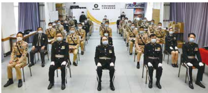
總監、助理總監及總區會長與獲獎者合照

因應疫情的情況，為了保障參加者的個人健康，典禮當日實行了一系列的預防措施，包括限制出席人數及座位安排、要求參加者保持社交距離等。