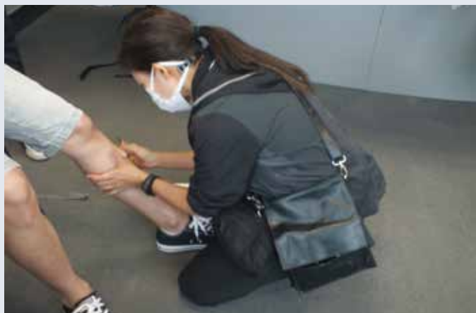
傷者偽裝工作進行中