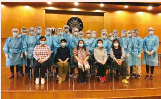
完成穿著個人防護裝備大合照