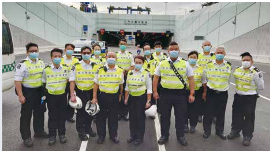
特遣隊全體演習人員

次聯合演習的統籌工作外，並聯同九龍總區特遣隊參與救援演習行動。當日救傷隊共派出約50位長官及隊員參與偽裝傷者扮演、救援演習及觀察員。演習在各單位通力合作下順利完成，達至預期效果。