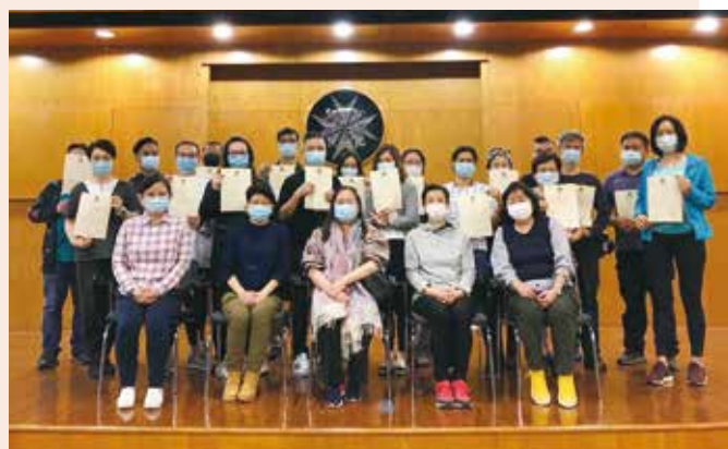
獲頒證書後大合照