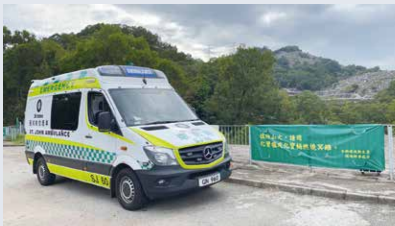
於清明節期間，派出救護車及人員駐守和合石墳場，為有需要之市民提供緊急救護服務

在疫情之下，救護車及運輸總區義務人員仍抱著「為人類服務」的宗旨為本港市民提供服務。在此感謝一直於疫情下(尤其在高峰期間)曾經出勤之長官及隊員的付出，亦感謝總區安排「防感染控制工作坊」、「N95呼吸器面型配合測試」及於後勤默默工作的長官及隊員的支援，為出勤人員提供適當的安全訓練及測試、整理保護裝備