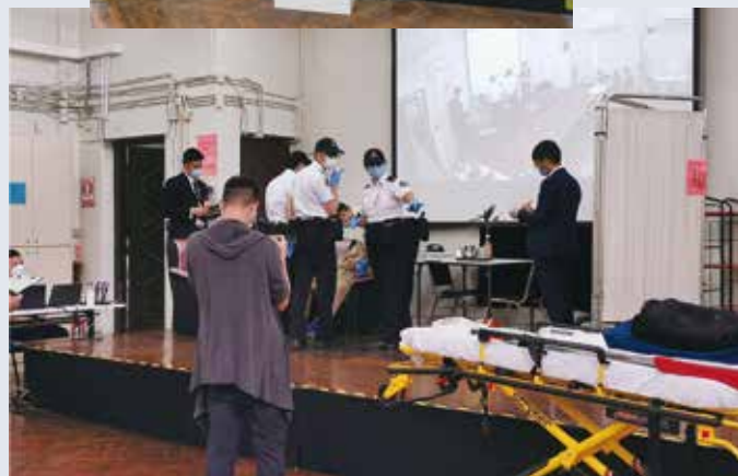
參賽人員進行模擬案例情況