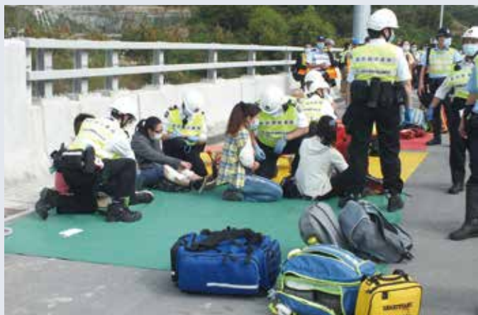
特遣隊隊員在現場護理傷者