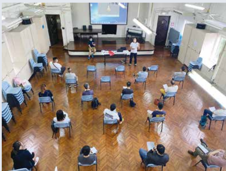
救護車及運輸總區人員積極參與「防感染控制工作坊」