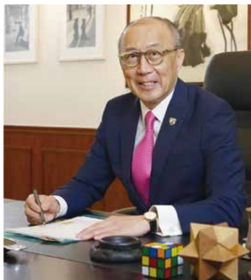
馬清楠律師擔任保良局主席時攝

進入互聯網時代，人與人之間的距離大大縮短了，溝通變得更容易及更緊密，但隨著各種通訊軟件流行，資訊泛濫的時代來臨，讓別有用心者有機可乘，不負責任的批評及帶有惡意的假信息充斥，無論是政商界、一些公眾人物，以至以服務社會為己任的非政府機構，都面臨重大衝擊，每天都可能因為一些不負責任的虛假消息散播，導致產生輿論或信心危機。以往「有麝自然香」的教條已經過時，換來的是隨時「閉門家裡坐，禍從天上來」，如何化危為機已成為一門學問，公關工作更成為各類機構的重要一環。