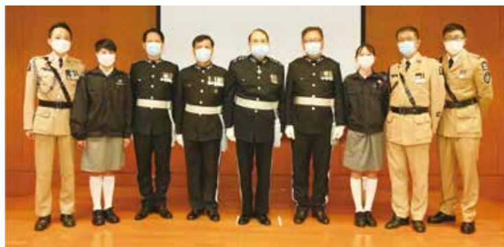
總監、助理總監及總區會長與典禮工作人員合照